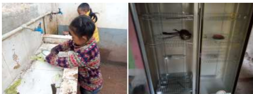
图III-3 就餐卫生情况组图（从左到右依次为餐前清洗、餐具消毒）