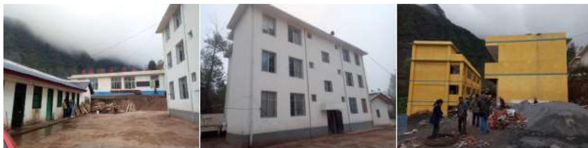
图 3 学校情况组图（分别为：老教学楼、教师宿舍、新教学楼）