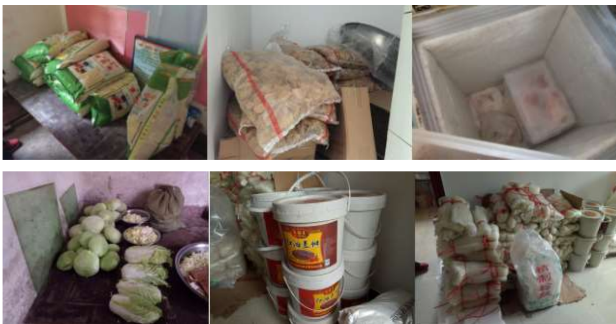
图I-3 食材储存情况组图 (结霜的冰箱)