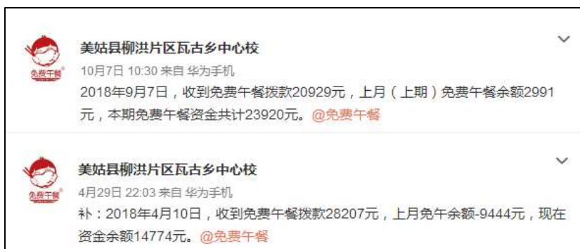
图 2 学校微博公示拨款截图