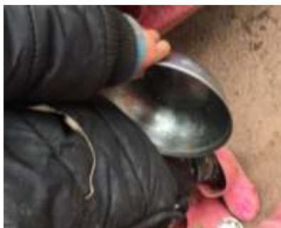
图III-4 未清洗干净的餐具情况图