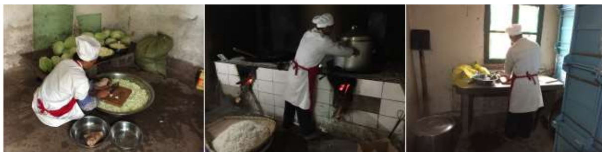
图I-2 厨师、厨房卫生情况组图