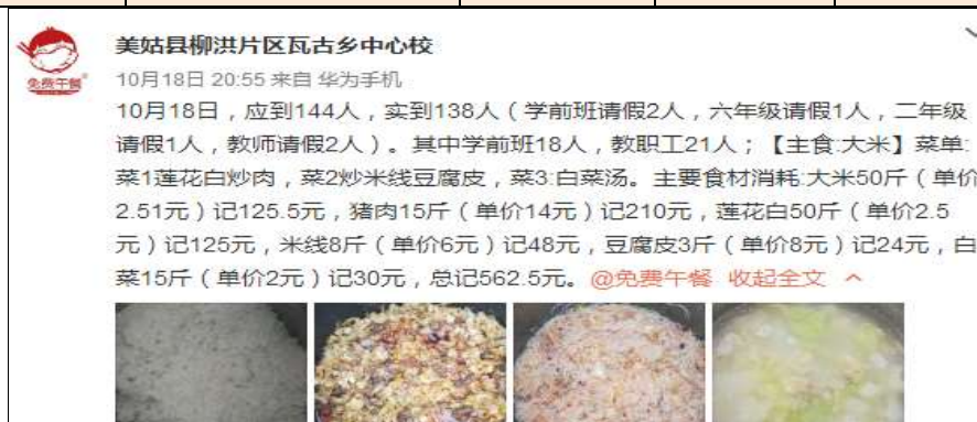
图IV-1 开餐当日微博截图