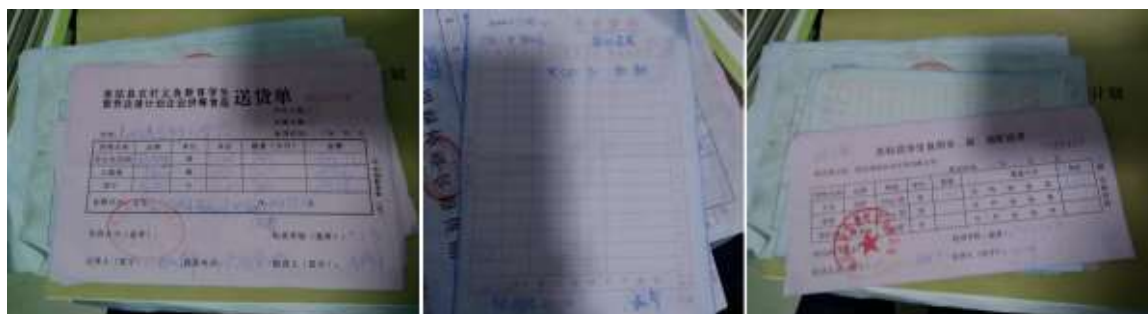
图II-1 不够清楚原始凭证组图