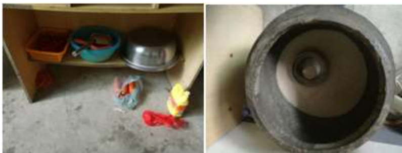
图I-2 食材储存情况组图