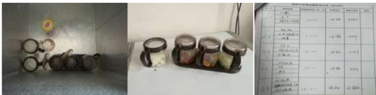
图I-3 食品留样情况组图