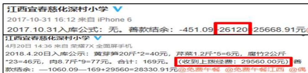
图 2 学校微博公示拨款截图