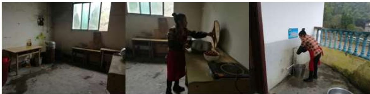
图I-1 厨师、厨房卫生情况组图