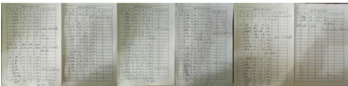
图II-2 入库登记单组图