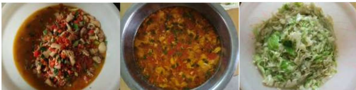
图III-1 稽核当天学生菜品情况组图