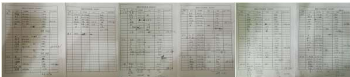
图II-3 出库登记单组图