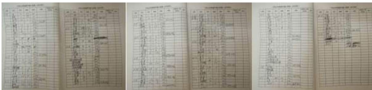
图II-1 入库登记单组图