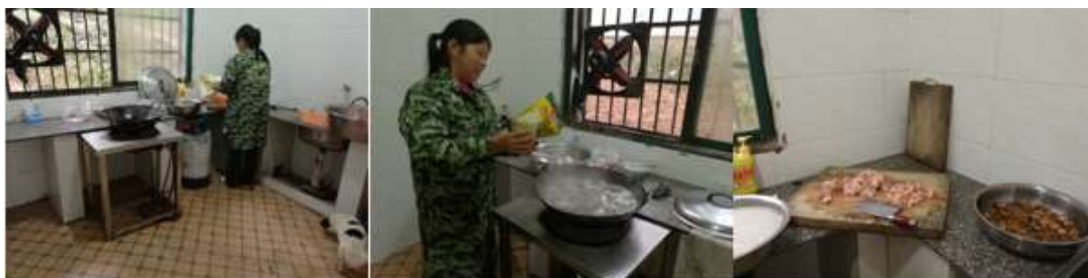
图I-2 厨师、厨房卫生情况组图