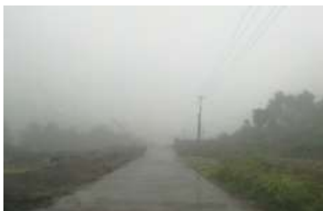
图 1 路况图

交通说明：自宜春市前往洪塘镇下坑小学，可在宜春市贸易广场汽车站坐 8：50 开往丰顶山方向的班车，在丰顶山下车，再租摩托车前往下坑小学。也可以在宜春市贸易广场汽车站坐开往洪塘方向的班车，在洪塘镇下车，再租摩托车前往下坑小学。