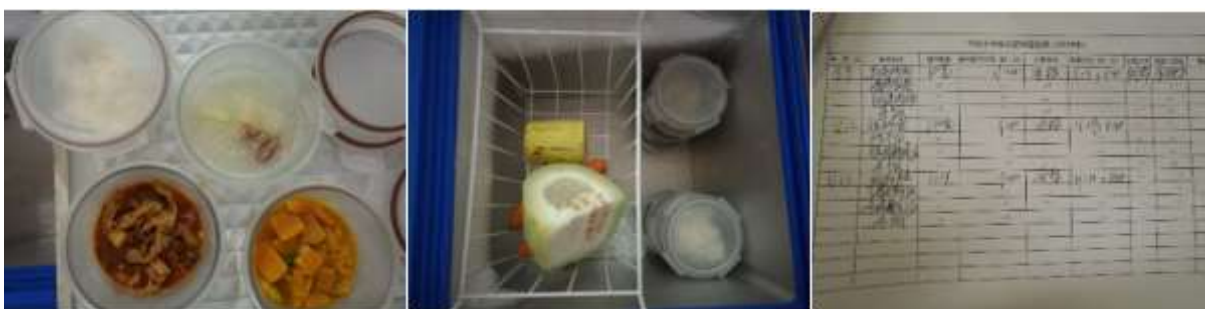
图I-4 食品留样情况组图