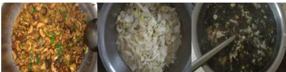
图III-1 稽核当天学生菜品情况组图