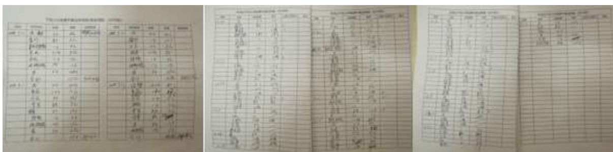
图II-2 出库登记单组图