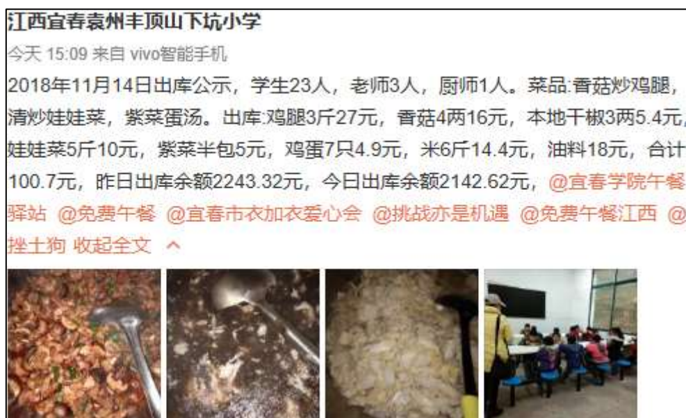
图IV-1 稽核当日微博截图