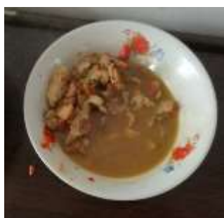
图III-5 老师午餐另外加炒肉情况图