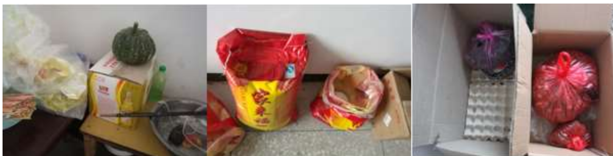
图I-3 食材储存情况组图