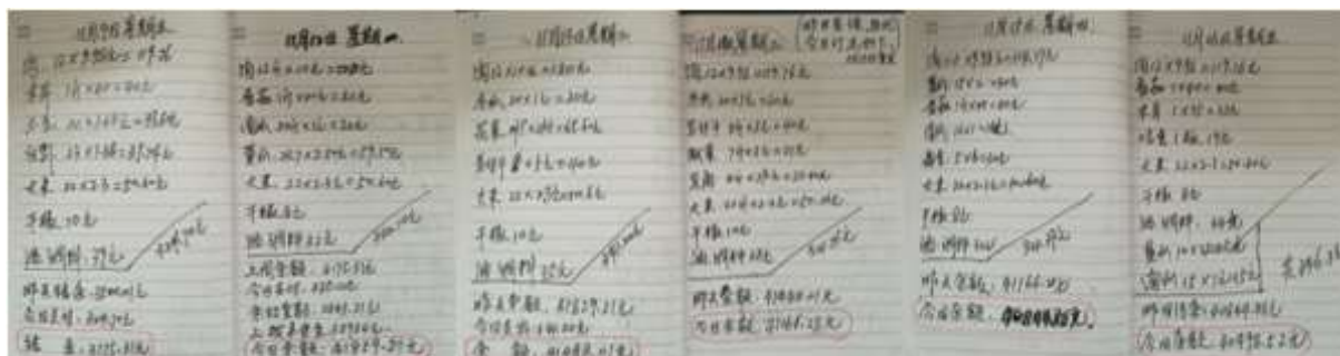
图II-2 出库登记、现金流账组图