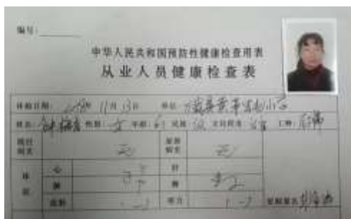
图I-1 厨师体检合格证图