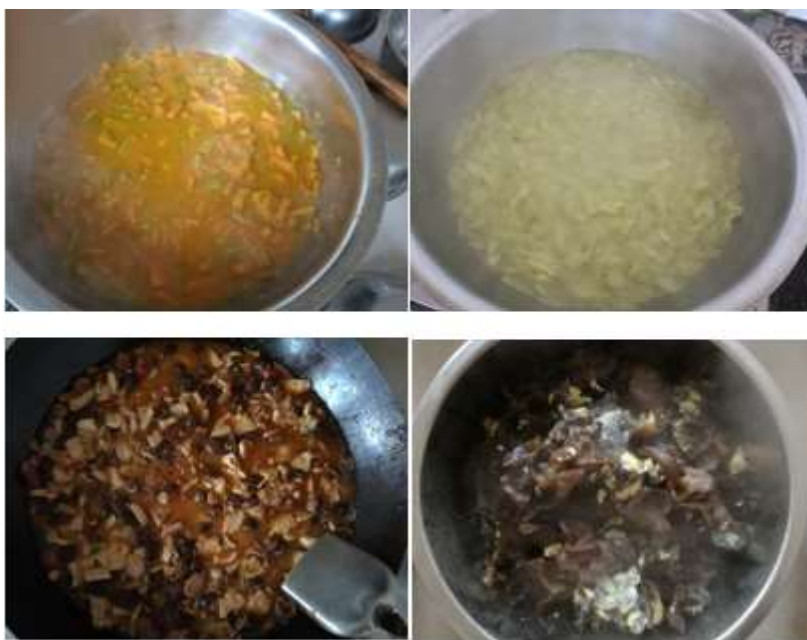
图III-1 稽核当天学生菜品情况组图