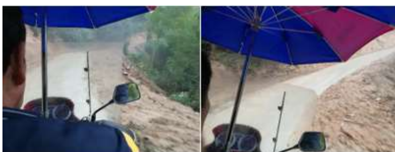
图 1 路况组图

交通说明：自万载县城前往黄茅镇军屯小学，可在万载县汽车站坐八点左右开往黄茅镇方向的班车，在黄茅镇下车，再租摩托车前往军屯小学。