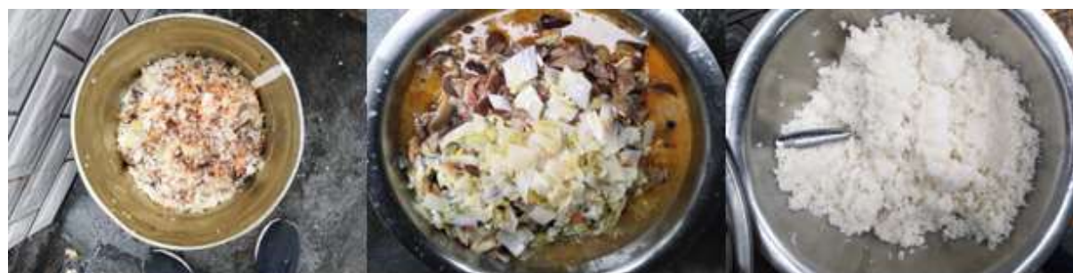
图III-4 餐后浪费情况组图