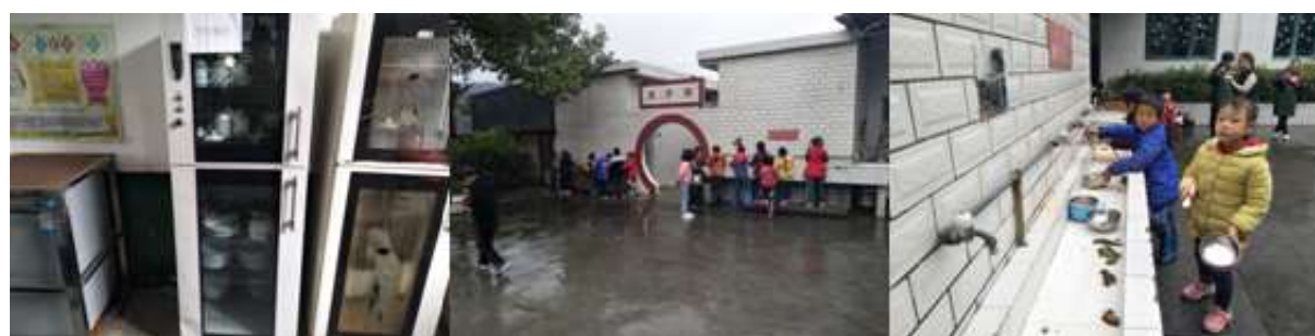
图III-3 就餐卫生情况组图（从左到右分别为餐具消毒、餐具清洗）