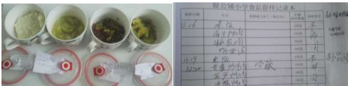
图I-4 食品留样情况组图