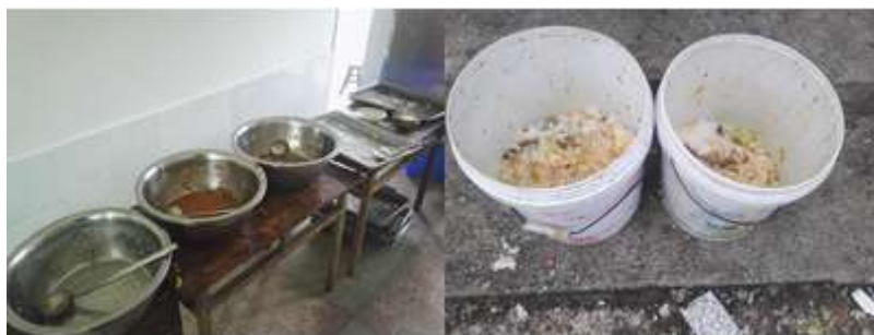
图III-4 剩菜剩饭情况组图（从左到右依次为剩菜剩饭、餐余）