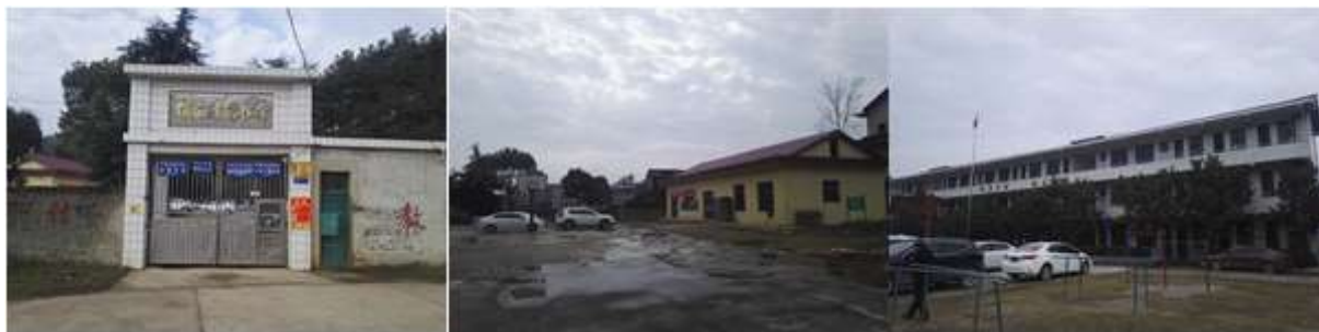
图 2 学校情况组图