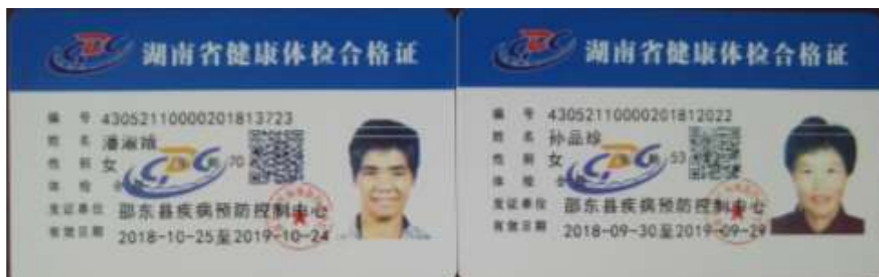
图I-1 厨师健康证组图