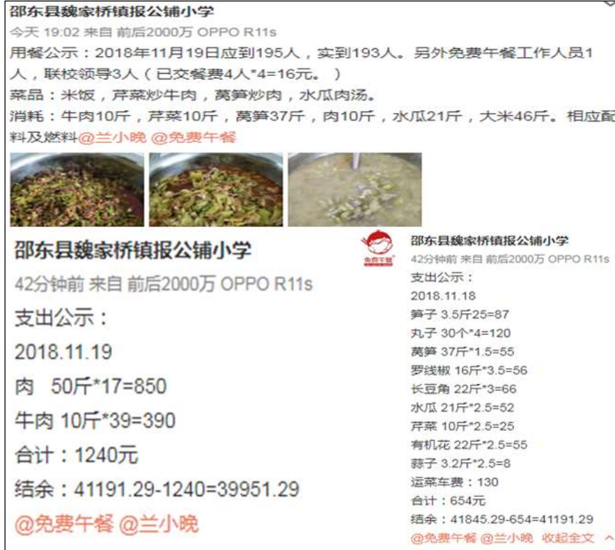
图IV-1 开餐当日微博截图