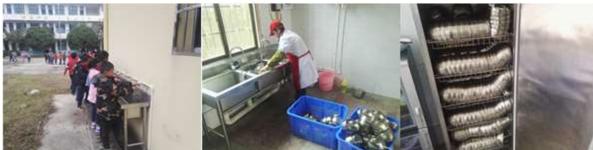
图III-3 就餐卫生情况组图（图一为餐前清手，图二、三为餐具的清洗与消毒）