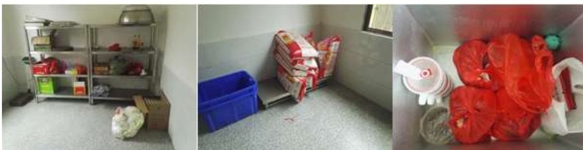
图I-3 食材储存情况组图