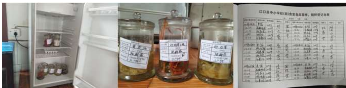
图I-4 食品留样情况组图