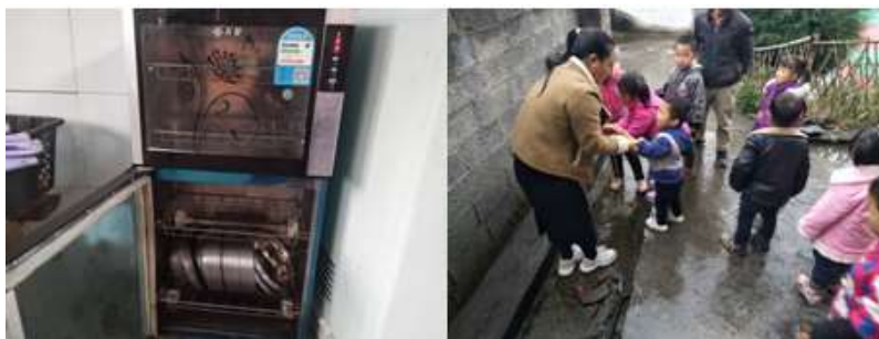
图III-3 就餐卫生情况组图（从左到右分别为餐具消毒、餐前洗手）