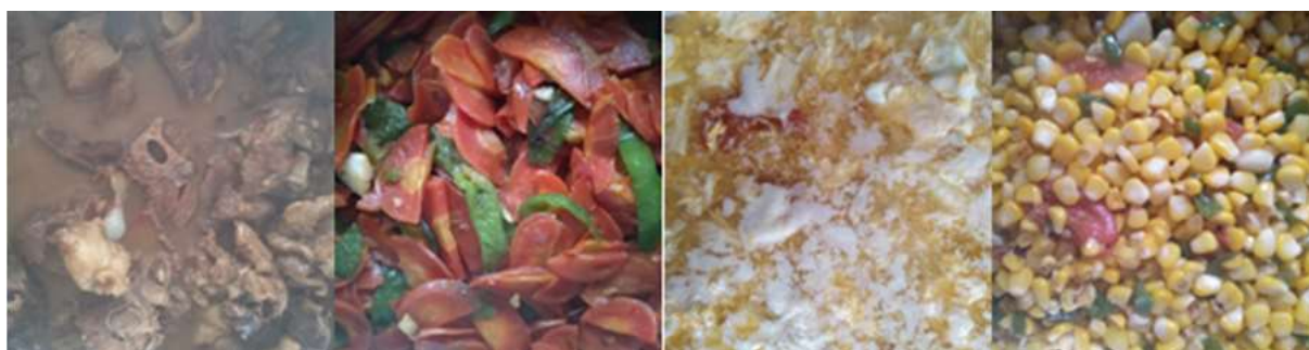
图III-1 开餐当天菜品情况组图