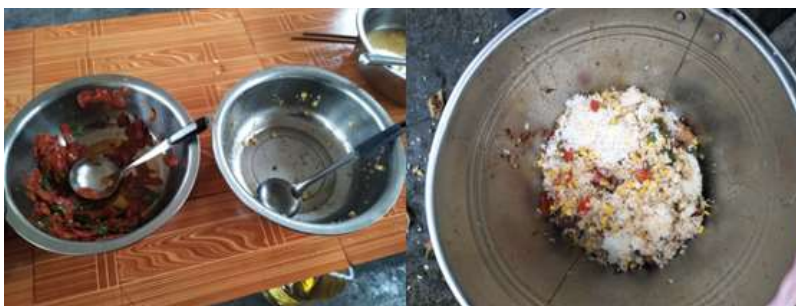
图III-4 餐后浪费情况组图