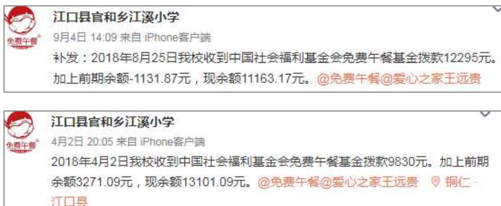
图2 学校微博公示拨款截图

说明：2018年3月27日和2018年8月15日官网公示已经拨款，官网公示拨款金额分别为9830元和12295元，2018年4月2日和2018年9月4日学校微博公示拨款分别为9830元和12295元，与实际相符。学校微博公示与官网公示拨款金额一致。