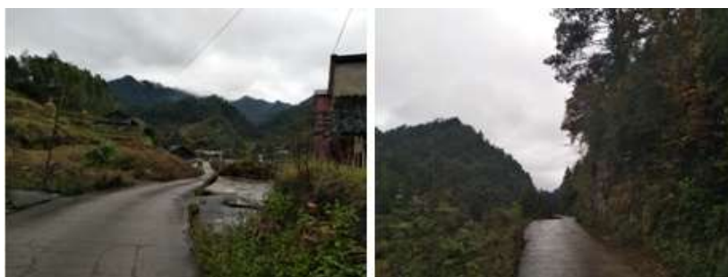
图 1 路况组图

交通说明：前往江溪小学可在江口客运站乘坐官和方向的班车到官和乡，再由官和乡乘坐摩托车到江溪小学（赶集天官和乡有前往江溪屯村的面包车可坐），全程由县道和乡道组成，县道在修路，路况较差，乡道路况较好。