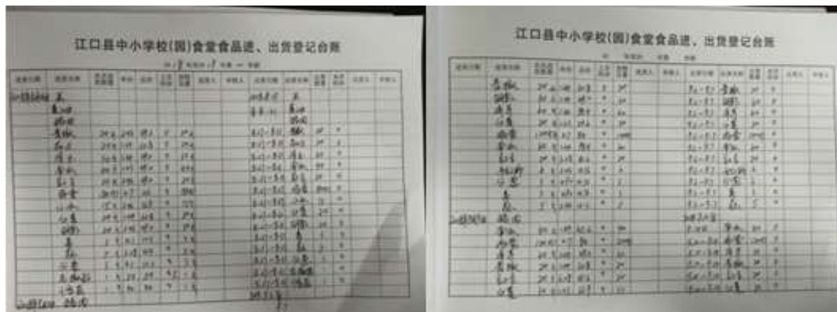
图II-2 出入库记录组图