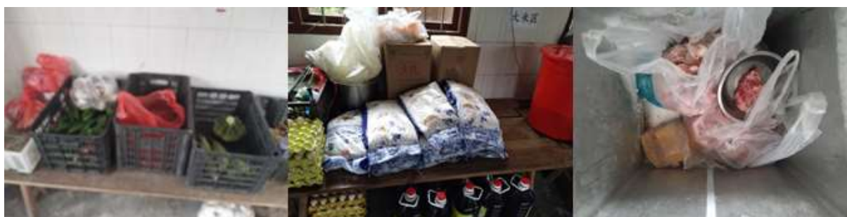
图I-3 食材储存情况组图