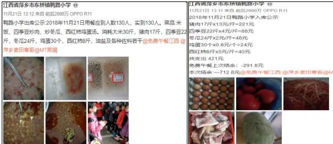
图IV-1 稽核当日微博截图