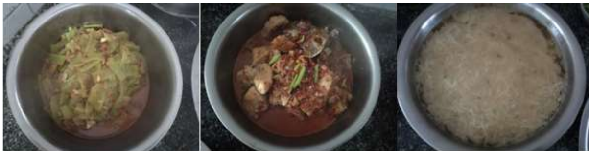
图III-5 稽核当天教职工菜品情况组图