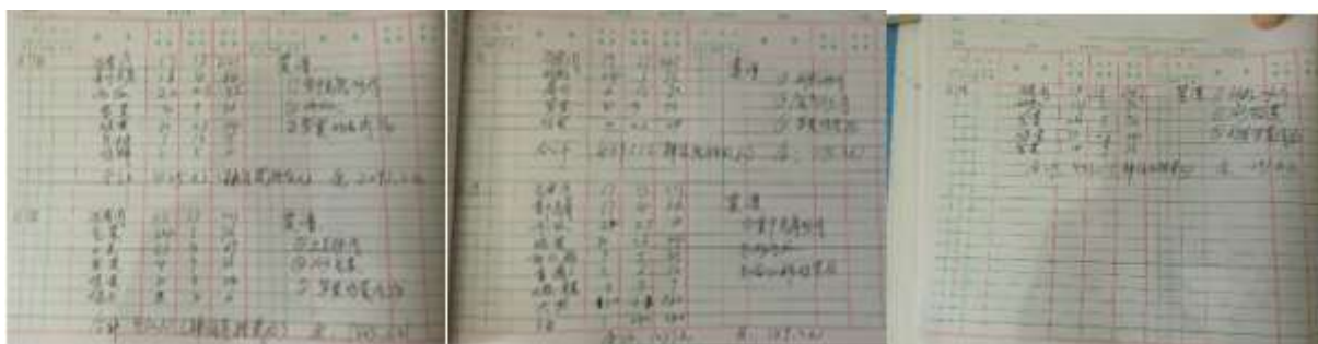
图II-2 出库登记单组图