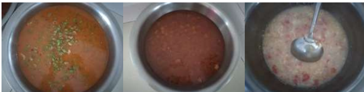
图III-1 稽核当天学生菜品情况组图