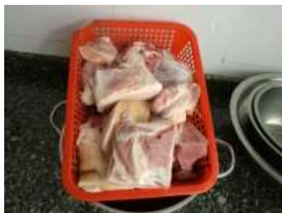
图II-4 稽核当天稽核员在学校肉菜做好后拍到的学校猪肉图片