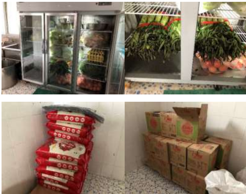
图I-3 食材储存情况组图