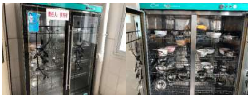
图III-3 用于教职工餐具消毒的消毒柜组图