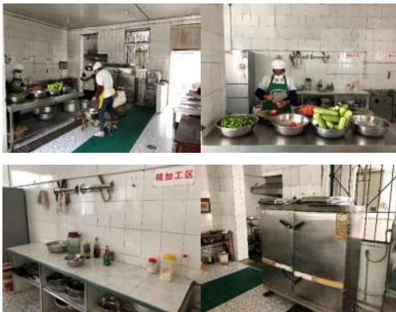
图I-2 厨师、厨房卫生情况组图