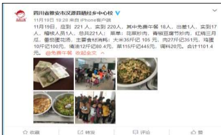
图IV-1 稽核当日学校微博公示截图