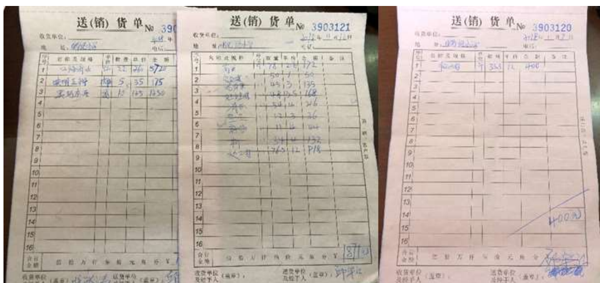
图II-1 采购原始凭证组图