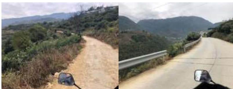
图 1 路况组图

交通说明：自汉源县城前往晒经乡中心小学可在汉源汽车站搭乘汉源至大树的客运面包车，抵达大树镇后换乘摩托车前往晒经乡中心小学，全程需约1小时10分钟。汉源县城至大树镇交通较为方便；大树镇至晒经乡段全程硬化路面，交通方便。