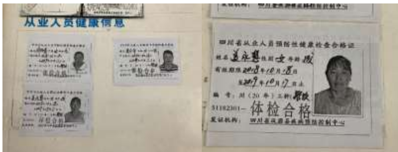
图I-1 厨师健康证组图