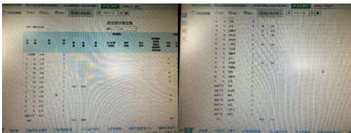
图II-2 出入库记录截屏组图