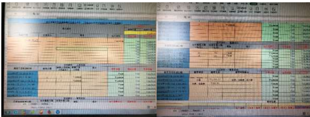
图II-3 财务总结报表截屏组图