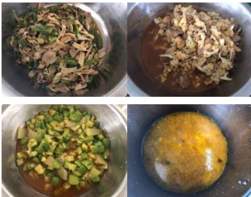
图III-1 稽核当日午餐菜品组图