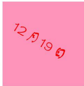
12月19日微博公示及菜品