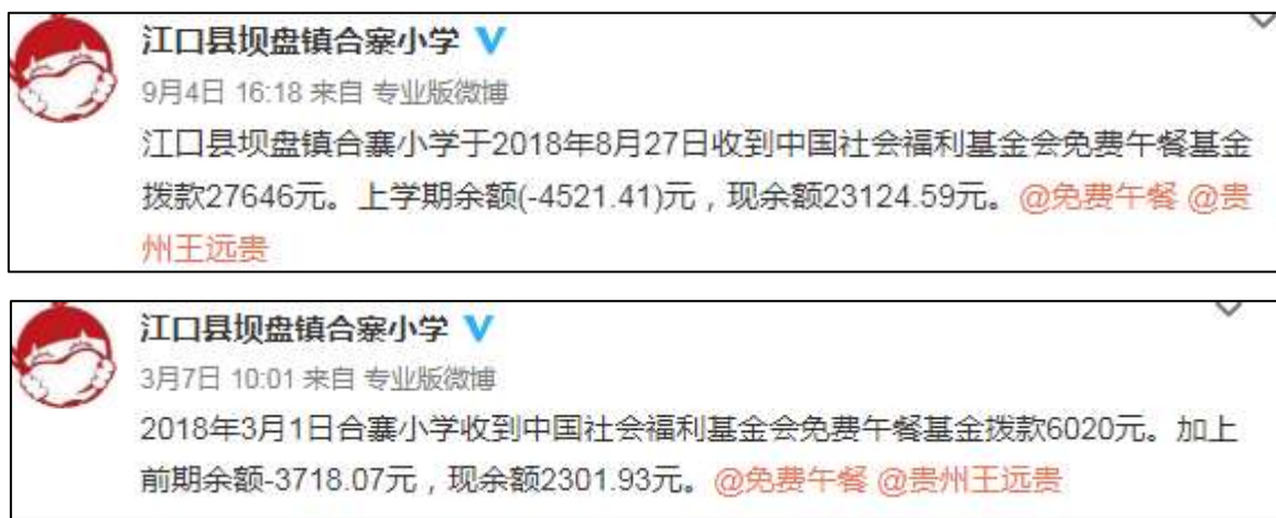
图 2 学校微博公示拨款截图