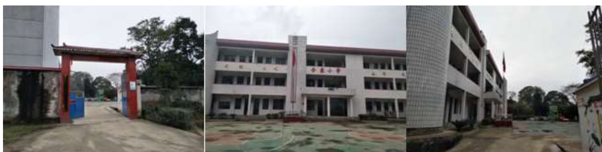
图 3 学校情况组图