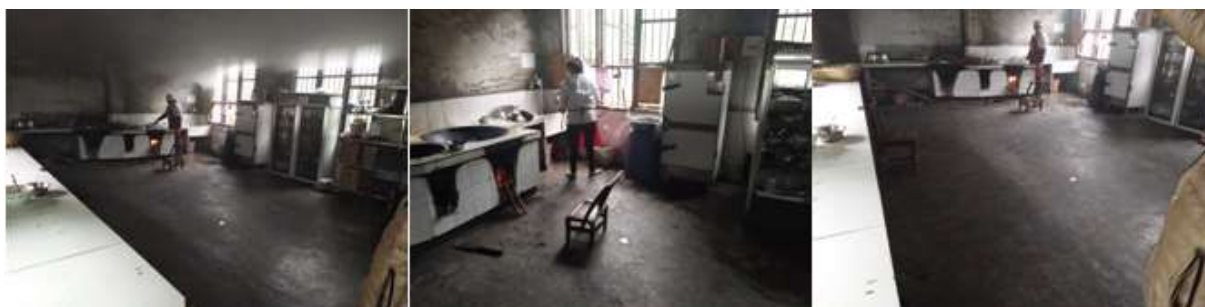
图I-2 厨师、厨房卫生情况组图