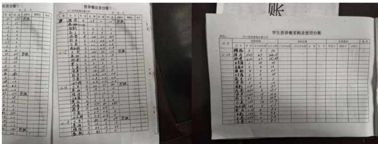
图II-2 出入库记录组图（从左到右分别为出库记录、入库记录）