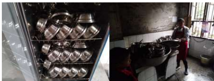
图III-3 就餐卫生情况组图（从左到右分别为餐具消毒、餐具清洗）