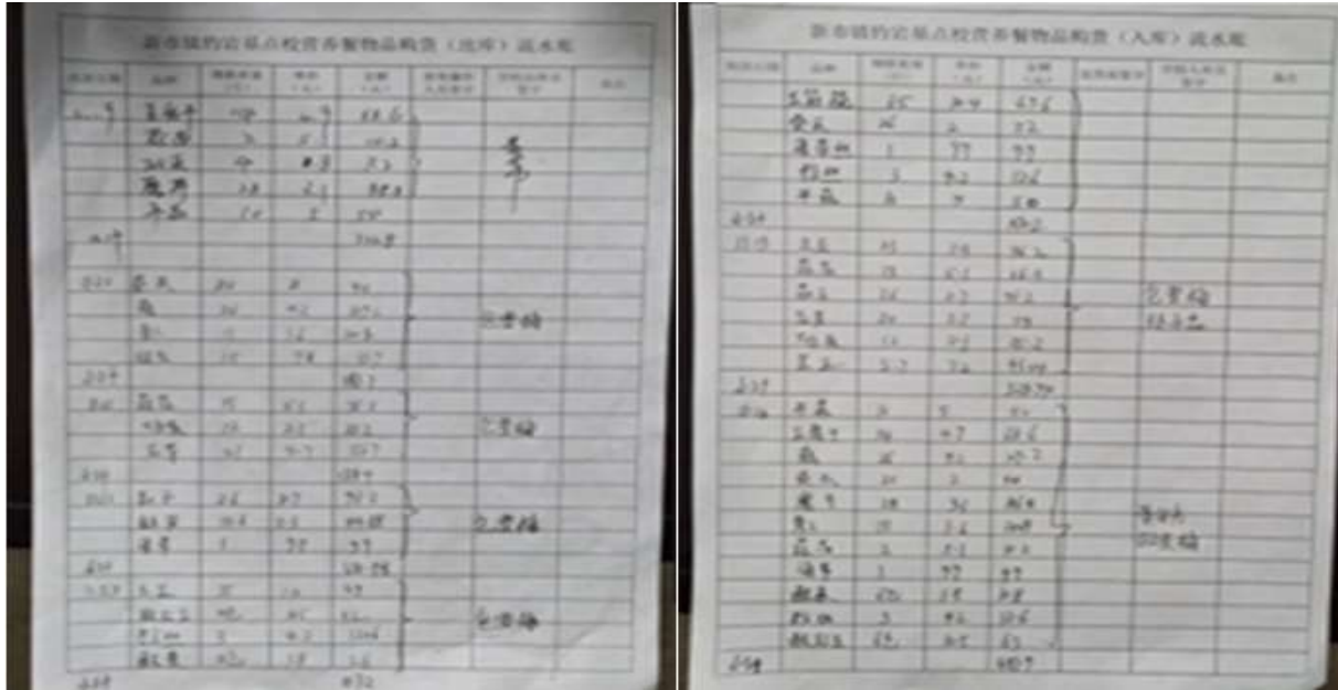
图II-2 出入库记录组图