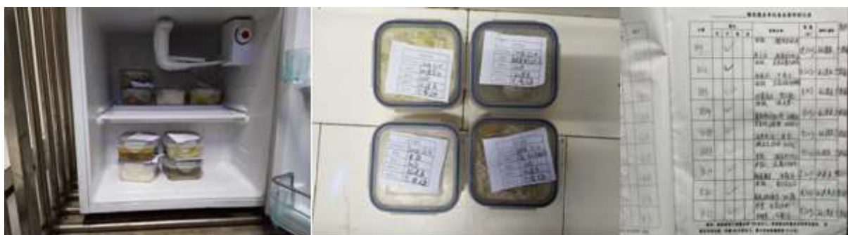
图I-4 食品留样情况组图