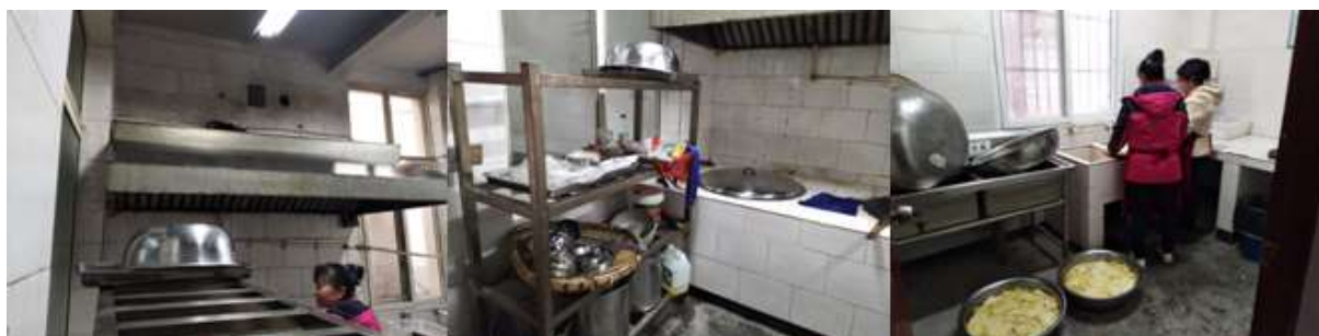
图I-2 厨师、厨房卫生情况组图