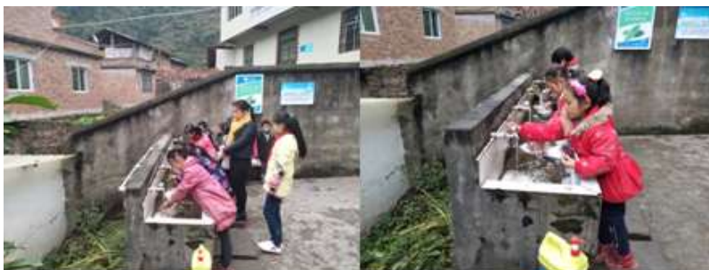
图III-3 就餐卫生情况组图（从左到右分别为餐前洗手、餐具清洗）