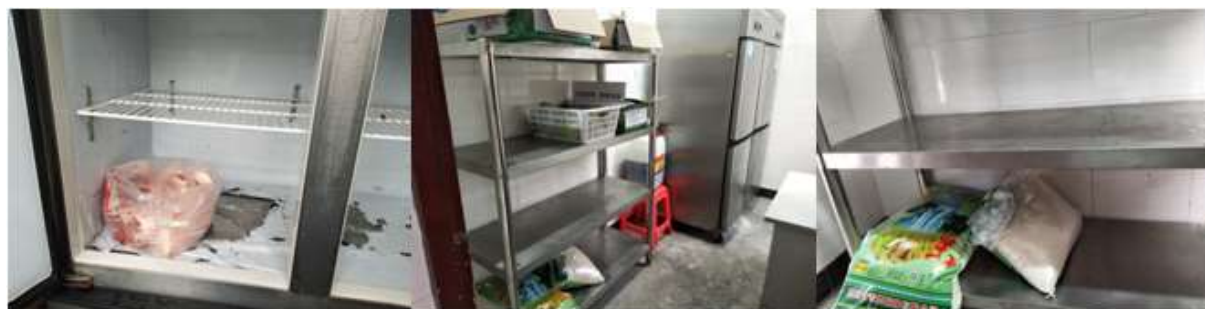
图I-3 食材储存情况组图