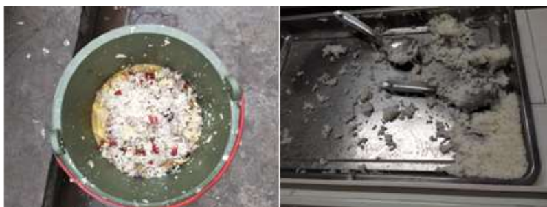
图III-4 餐后剩余情况组图