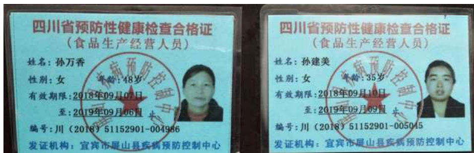
图I-1 厨师健康证组图