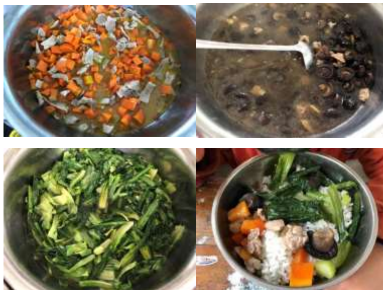
图III-1 稽核当日午餐菜品组图