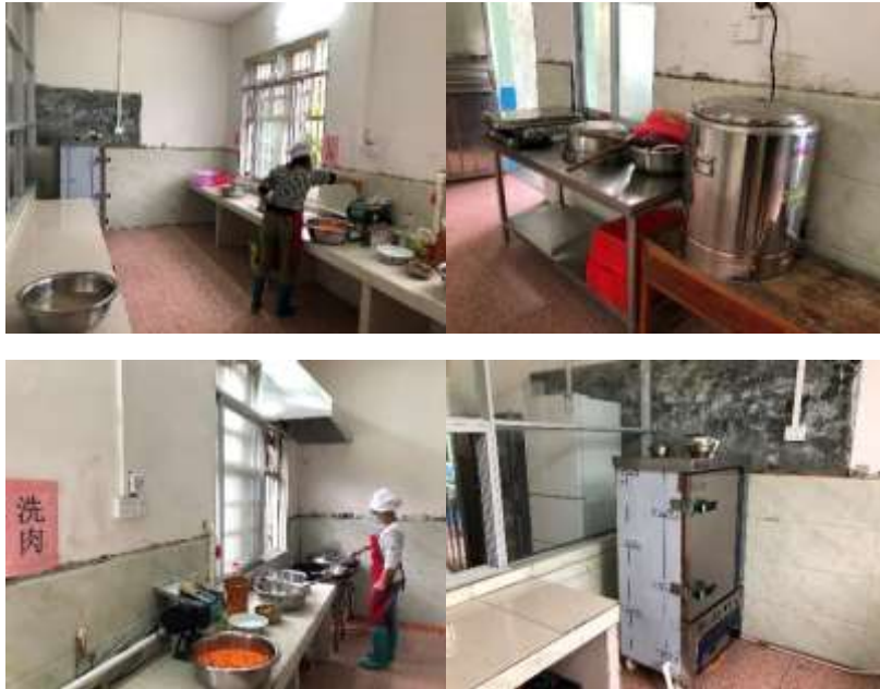
图I-2 厨师、厨房卫生情况组图