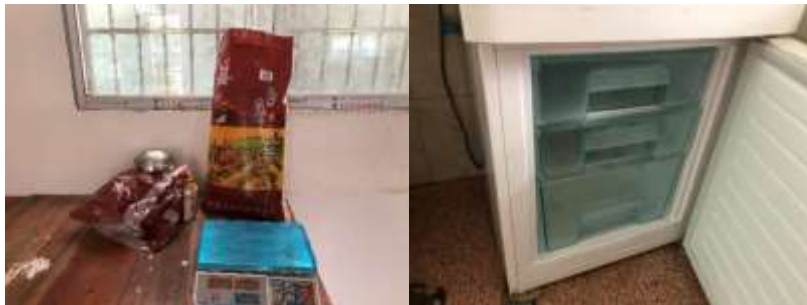
图I-3 食材储存情况组图