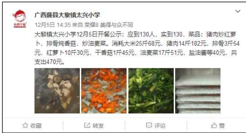
图IV-1 稽核当日学校微博公示截图