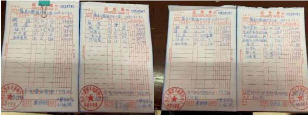
图II-1 采购原始凭证组图