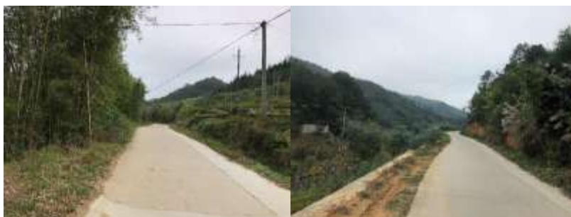
图 1 路况组图

交通说明：自藤县县城前往大黎镇太兴小学可在县城信用联社公交站乘坐早上第一班7点出发的藤太专线客车，约8点20分抵达太平镇汽车站，再换乘8点25分自太平镇开往大黎镇上荣村的客车，约10点30分抵达大黎镇那荣村口，下车后可徒步约3公里前往太兴小学，也可搭乘摩托车前往该校，全程路况良好，交通相对方便。