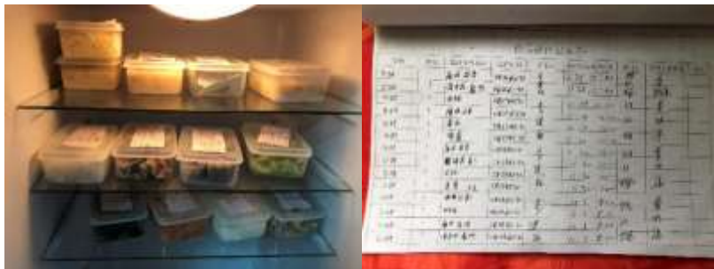
图I-4 食品留样情况组图