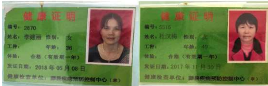
图I-1 厨师健康组证组图