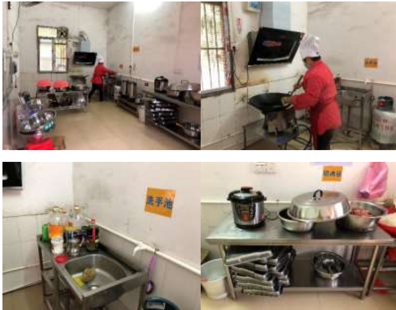
图I-2 厨师、厨房卫生情况组图