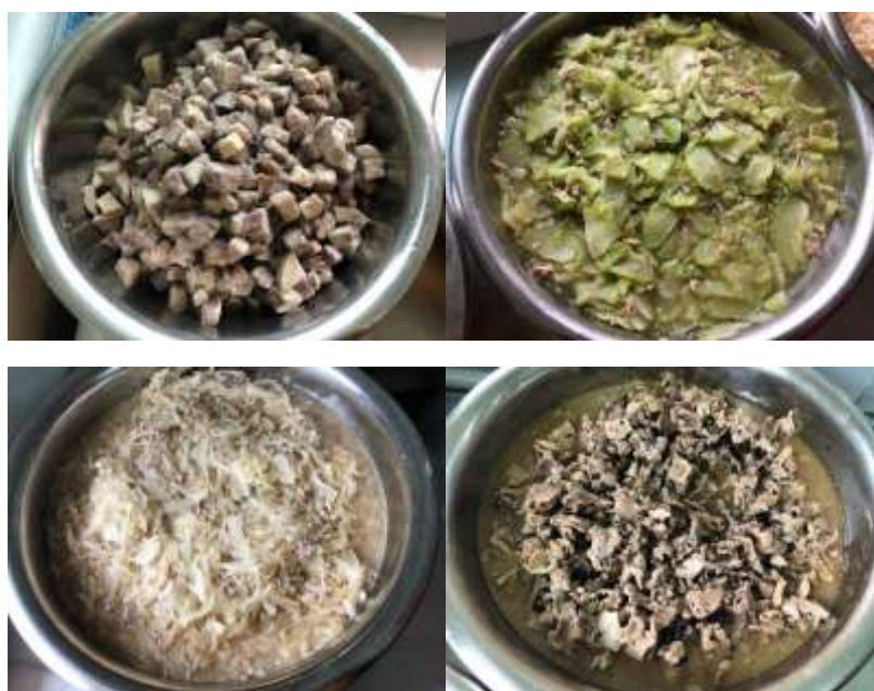
图III-1 稽核当日午餐菜品组图