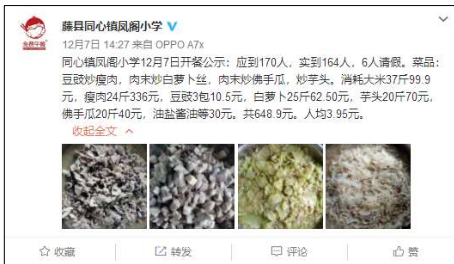
图IV-1 稽核当日学校微博公示截图