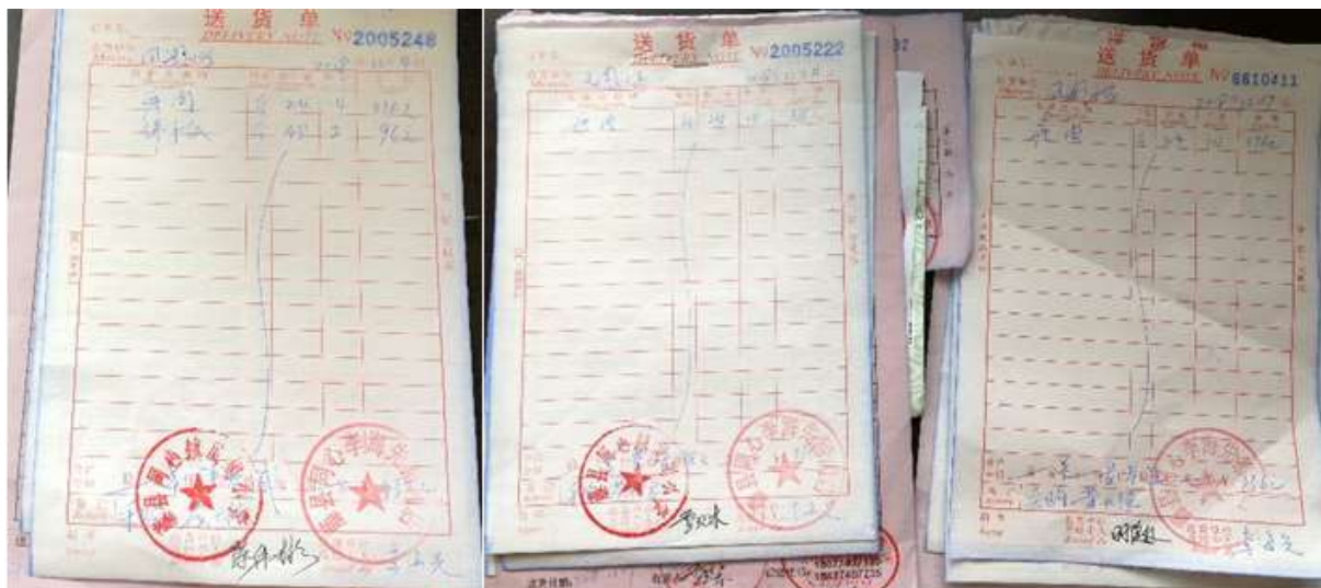
图II-1 采购原始凭证组图