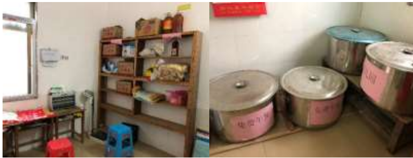
图I-3 食材储存情况组图