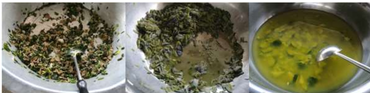
图III-1 稽核当天菜品情况组图