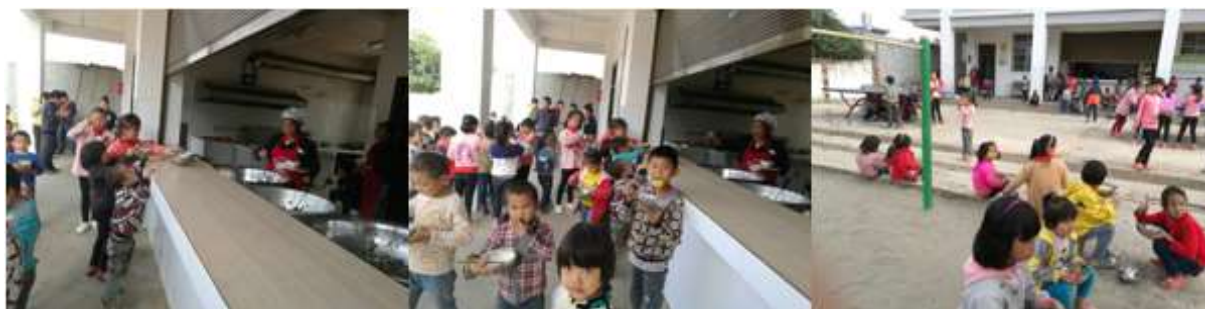
图 III-2 就餐情况组图