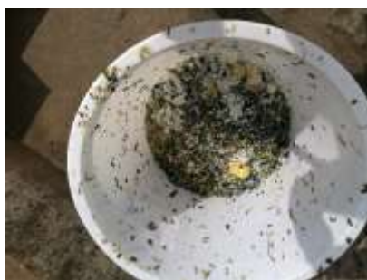
图 III-4 餐后情况图