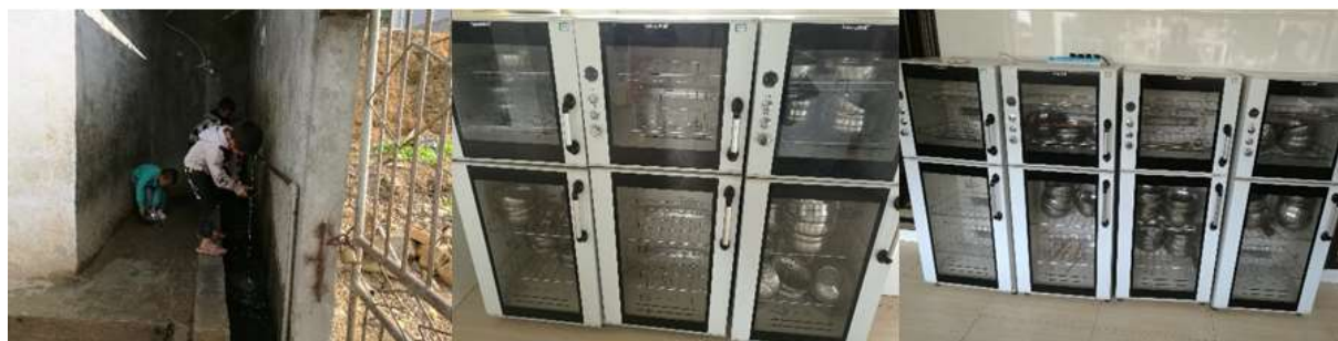
图 III-3 用餐卫生情况组图