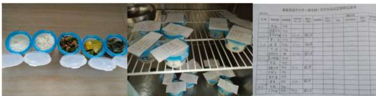
图I-4 食品留样情况组图