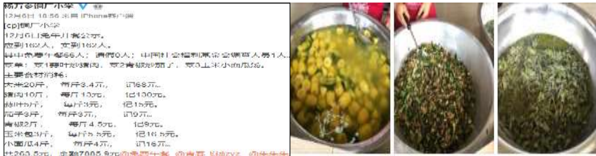
图IV-1 稽核当日微博公示图