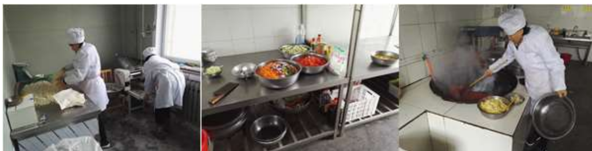
图I-2 厨房操作间及厨师卫生情况组图