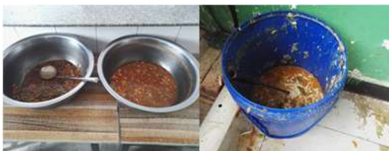
图III-4 剩菜剩饭与餐余组图