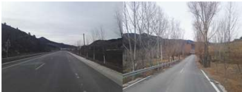
图 1 路况组图

交通说明：自沁水县城前往土沃村，在县城清华园叉路口的临时车站有 9:20 的班车直达土沃乡土沃村。