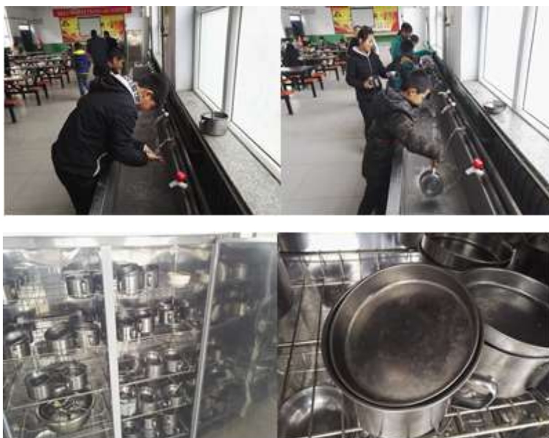
图III-3 餐前洗手与餐具卫生、消毒组图（下排第二图为餐具卫生情况）