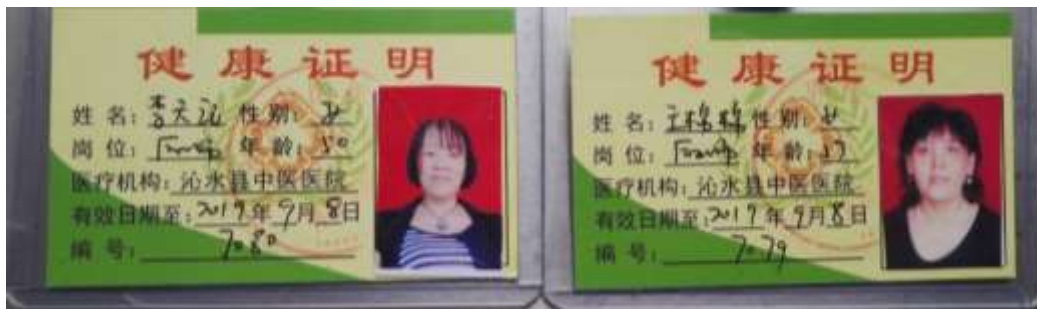
图I-1 厨师健康证组图