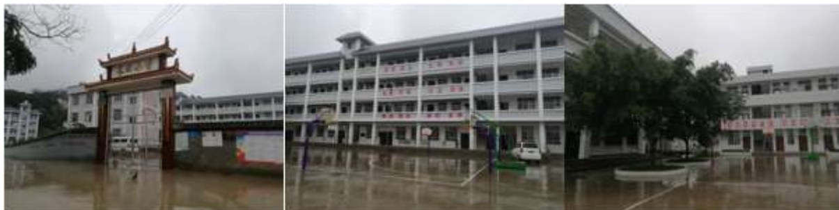
图 3 学校情况组图