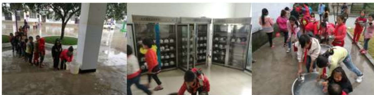
图III-3 用餐卫生情况组图