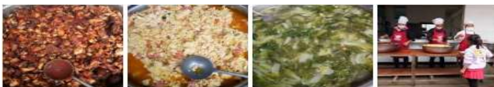
图IV-1 稽核当日微博公示截图