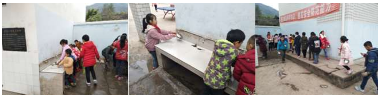
图III-3 就餐卫生情况组图（从左到右分别为餐具消毒、餐前洗手、餐具清洗）