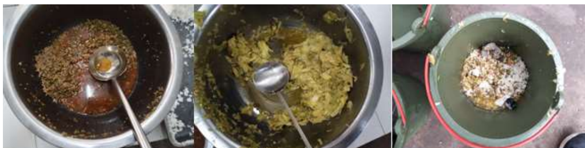
图III-4 餐后浪费情况组图