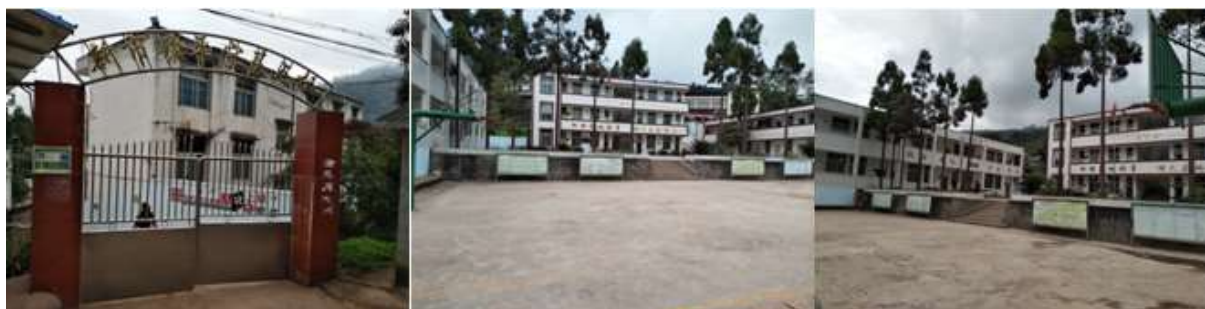
图 3 学校情况组图