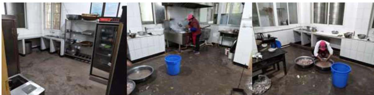
图I-2 厨师、厨房卫生情况组图