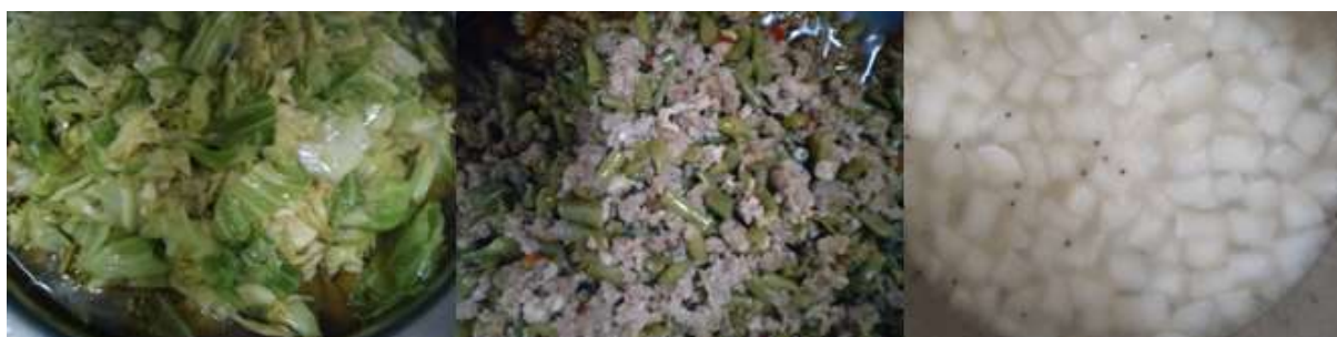
图III-1 开餐当天菜品情况组图