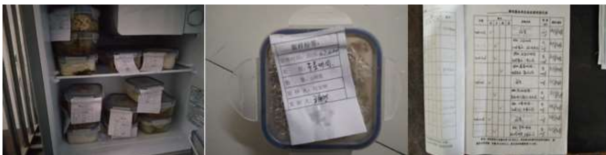
图I-4 食品留样情况组图