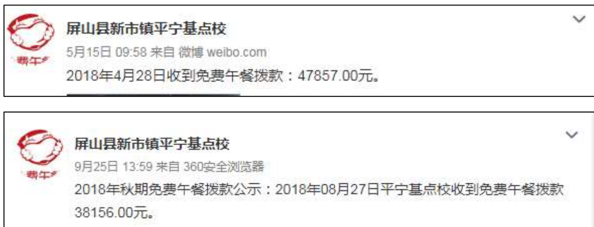
图 2 学校微博公示拨款截图

额分别为 47857 元、38156 元，2018 年 5 月 15 日和 2018 年 9 月 25 日学校微博公示拨款分别为 47857 元和 38156 元，与实际相符。学校微博公示与官网公示拨款金额一致。