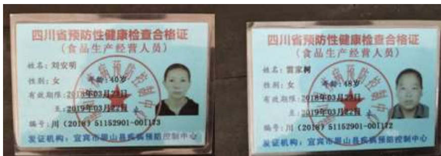
图I-1 厨师健康证组图