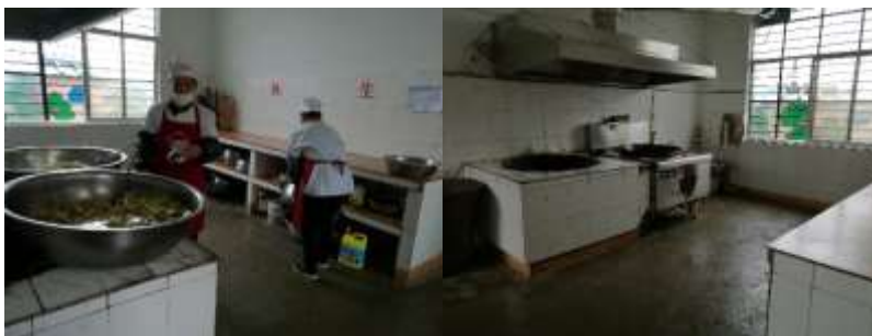
图I-2 厨师、厨房卫生情况组图