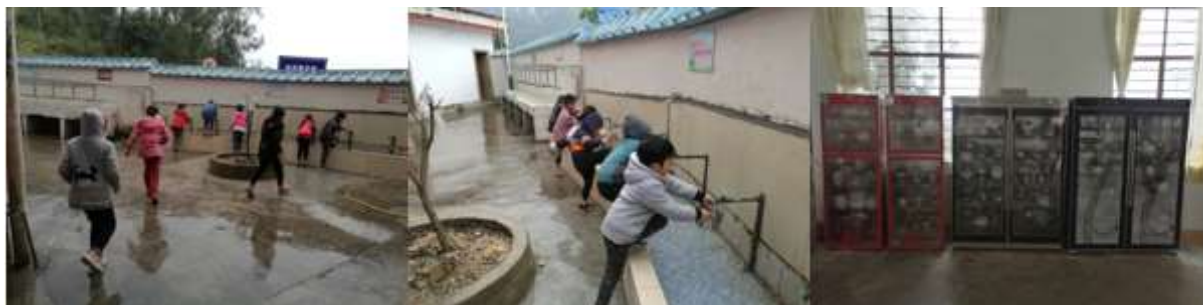
图III-3 用餐卫生情况组图