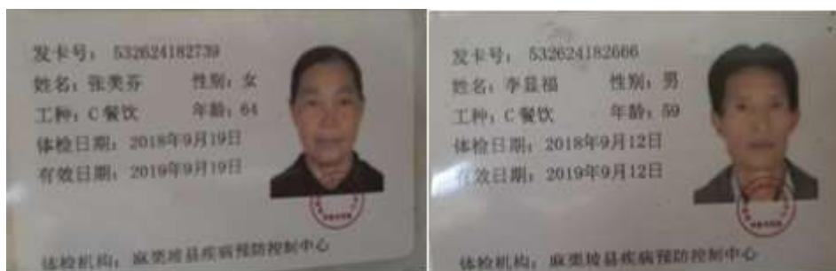
图I-1 厨师健康证组图