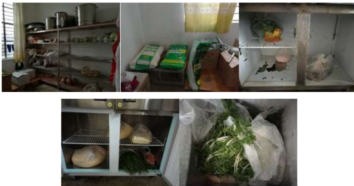
图I-3 食材储存情况组图