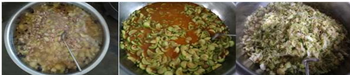
图III-1 稽核当天菜品情况组图