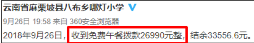
图2 学校微博公示拨款情况组图