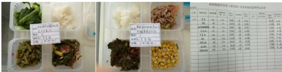
图I-4 食品留样情况组图