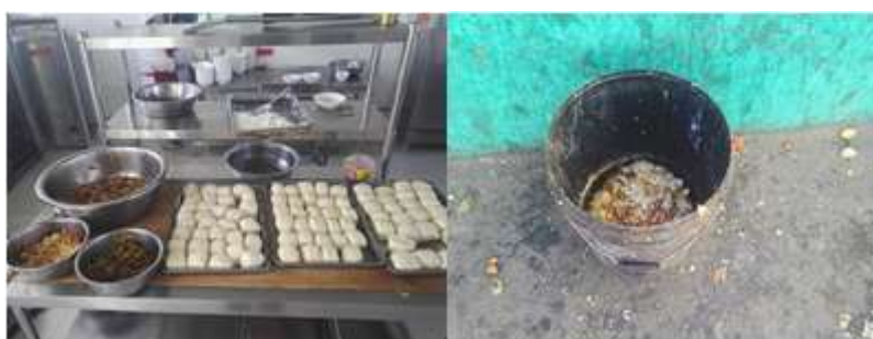
图III-4 剩菜剩饭与餐余组图