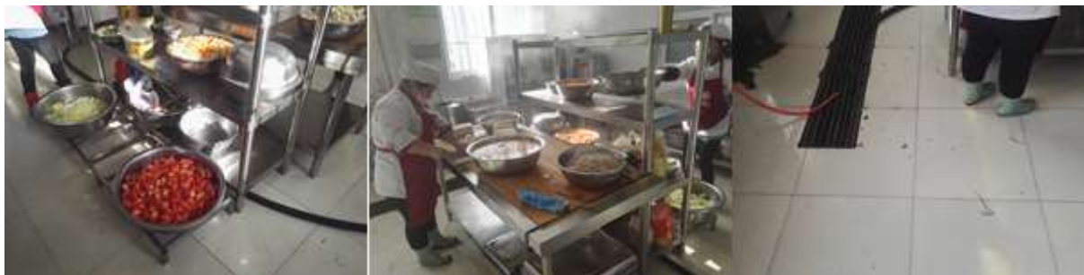
图I-2 厨房操作间及厨师卫生情况组图 (第三图为地面卫生情况)