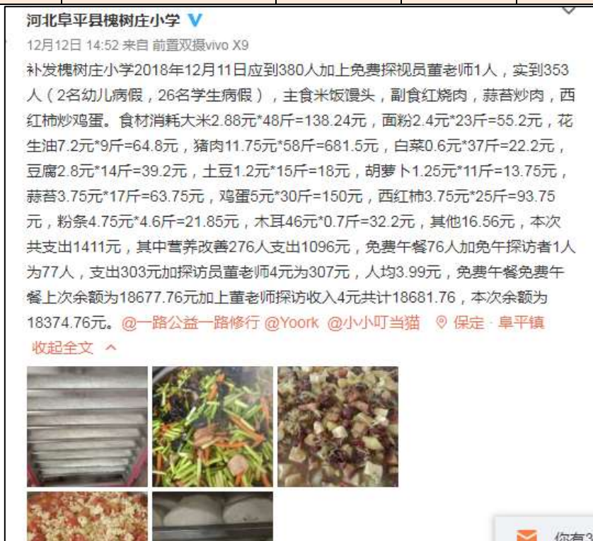
图IV-1 开餐当日微博截图