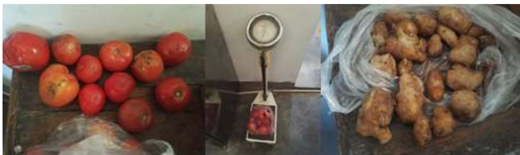
图I-3 食材储存情况组图 (下排图为变质的蔬菜情况)