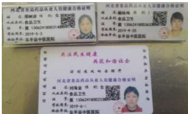
图I-1 厨师健康证组图