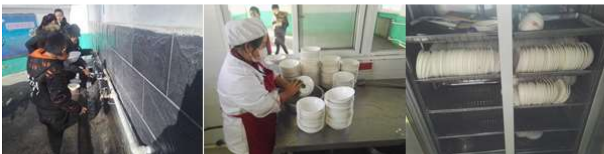
图III-3 餐具卫生与消毒组图