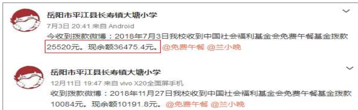
图2 学校微博公示拨款截图

说明：最近两次拨款学校均有微博开餐公示和资金结余说明，近期微博拨款公示与官网拨款记录一致。在2018年6月11日免费午餐官网显示拨款18024元，但学校在7月3日公示到账25520元，此处公示与官网拨款记录不一致，需学校服务中心伙伴与学校进行沟通确认。