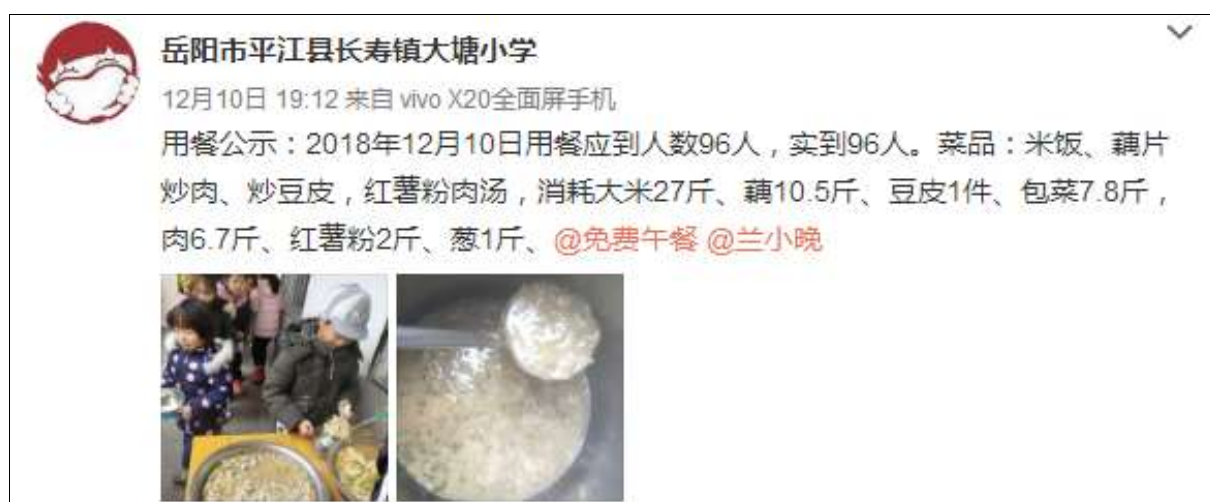
图IV-1 开餐当日微博公示图