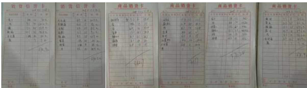
图II-1 原始凭证组图（缺少签字及供货商信息）