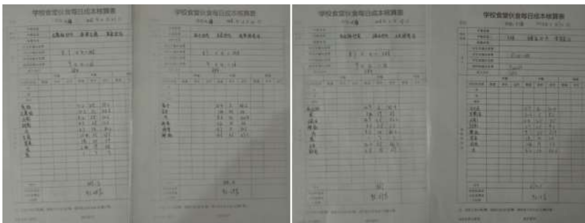
图II-2 每日开餐成本核算表组图