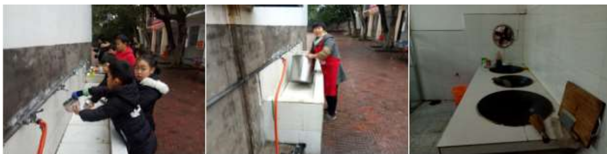
图III-3 就餐卫生情况组图（从左至右依次为餐后清洗、厨房餐后卫生情况）