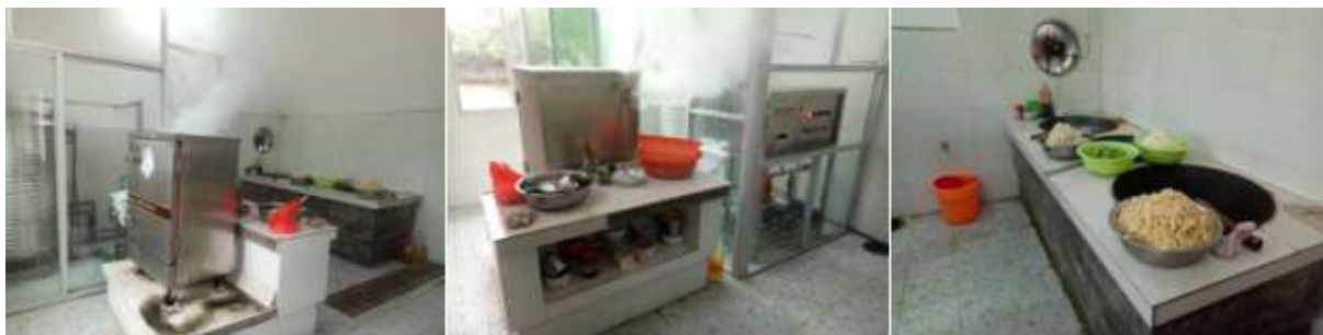
图I-2 厨房卫生情况组图