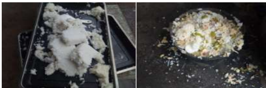
图III-4 餐后剩余与浪费情况组图