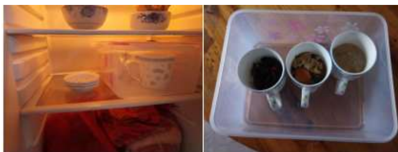
图I-4 不合格的食品留样组图