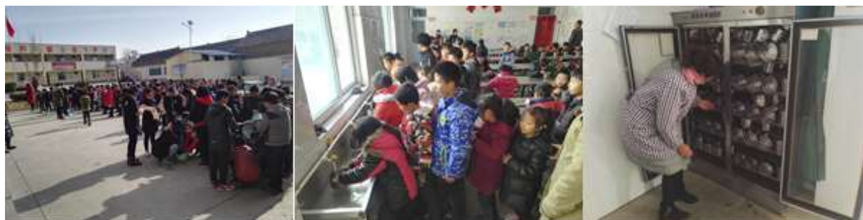
图III-3 餐前洗手与餐具卫生、消毒组图