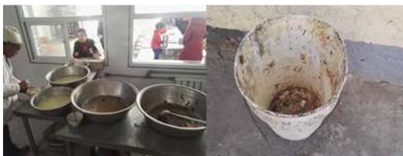
图III-4 剩菜剩饭与餐余组图