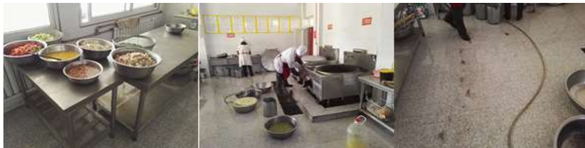
图I-2 厨房操作间及厨师卫生情况组图 (第三图为厨房地面卫生情况)