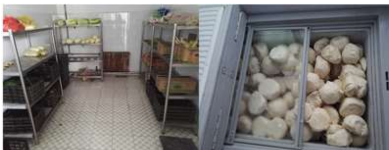
图I-3 食材储存情况组图 (第二图为冰箱食材储藏情况)