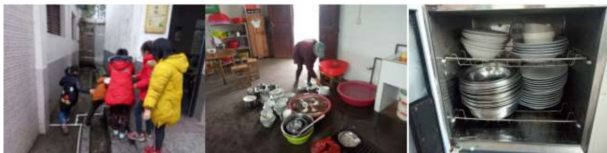
图III-3 就餐卫生情况组图（从左至右依次为餐前洗手、餐后清洗、餐具消毒）