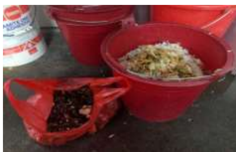
图III-5 餐后浪费情况图