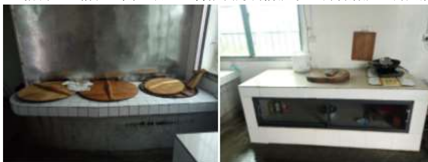
图III-4 餐后操作台卫生情况组图