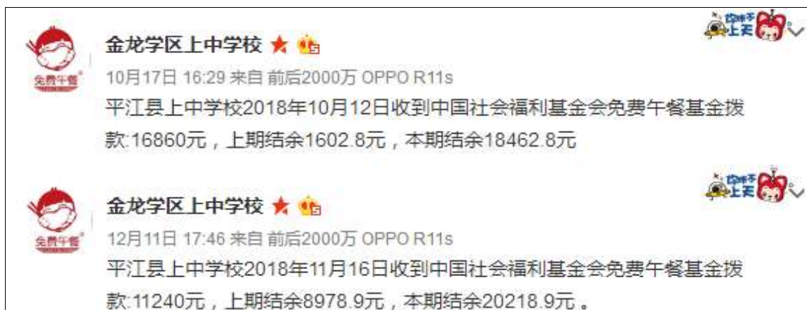
图2 学校微博公示拨款截图

说明：最近两次拨款学校均有微博开餐公示和资金结余说明，公示时间较为及时，且微博拨款公示与免费午餐官网拨款金额一致。