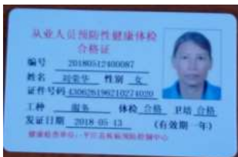
图I-1 厨师健康证图（缺少 1 人）