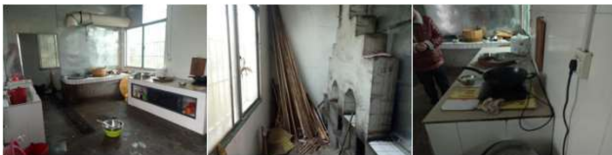
图I-2 厨房卫生情况组图