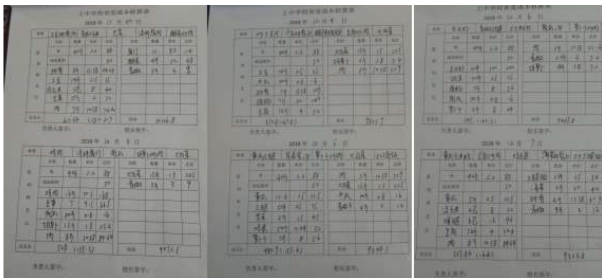
图II-4 每日成本核算表组图