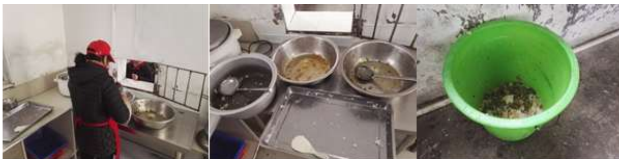
图III-4 剩菜剩饭与餐余组图（第一图为学生用餐未结束已无饭菜的情况）