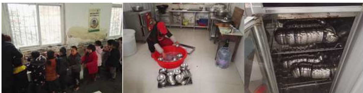
图III-3 餐前洗手与餐具卫生、消毒组图