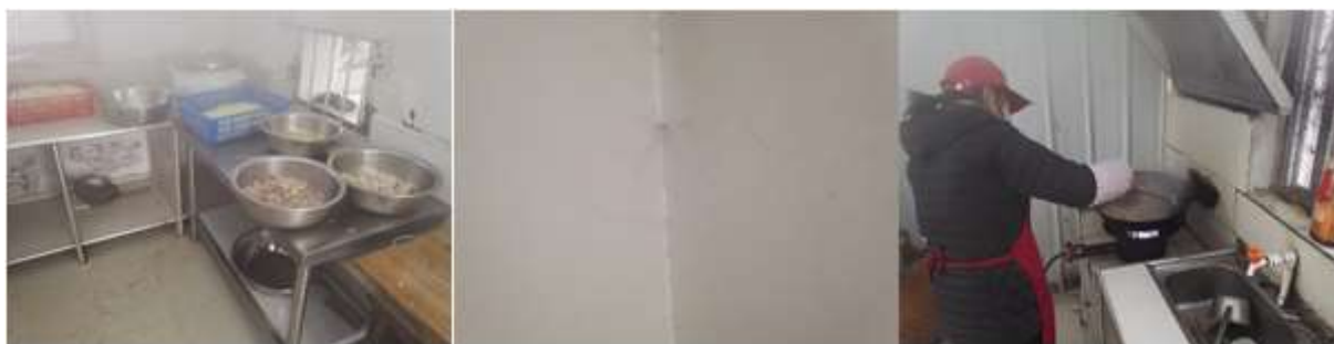
图I-2 厨房操作间及厨师卫生情况组图