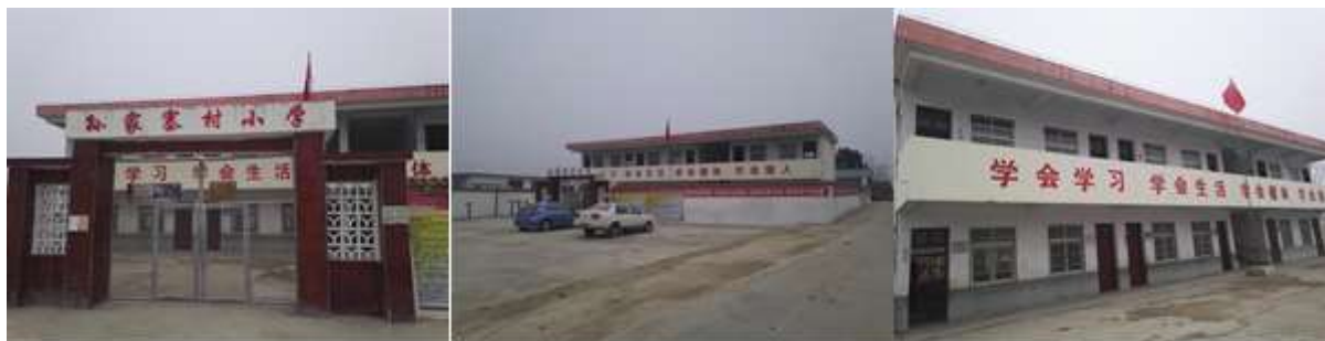
图 2 学校情况组图