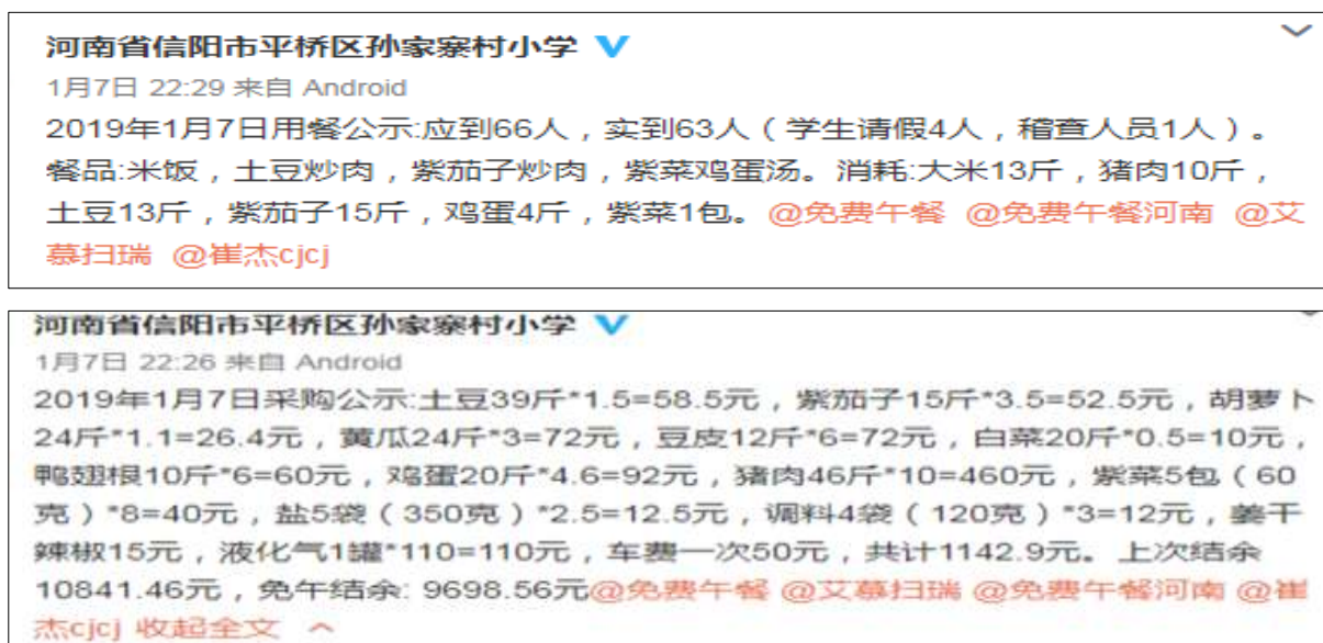
图IV-1 开餐当日微博截图