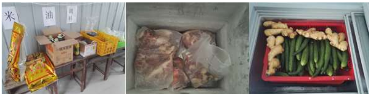
图I-3 食材储存情况组图 (第三图为冰柜内没有采取隔离的食材)