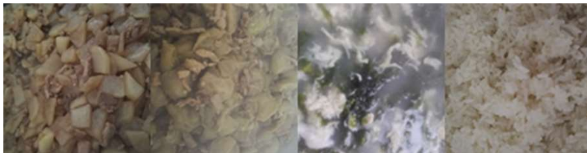
图III-1 开餐当天菜品情况组图