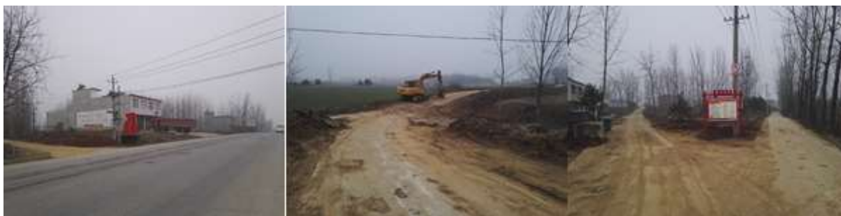
图 1 路况组图

交通说明：自信阳市区前往孙家寨村，需在信阳弘运汽车站乘坐班车至明港镇，再从明港镇杨楼汽车站乘坐班车至王岗乡，打车或步行约7公里即到达孙家寨村。上午的班车情况是，6:30首班车，每趟班车发车间隔时间为15分钟。