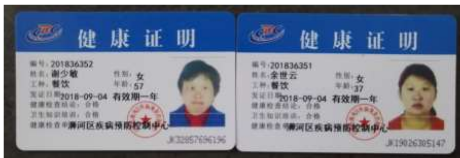
图I-1 厨师健康证组图