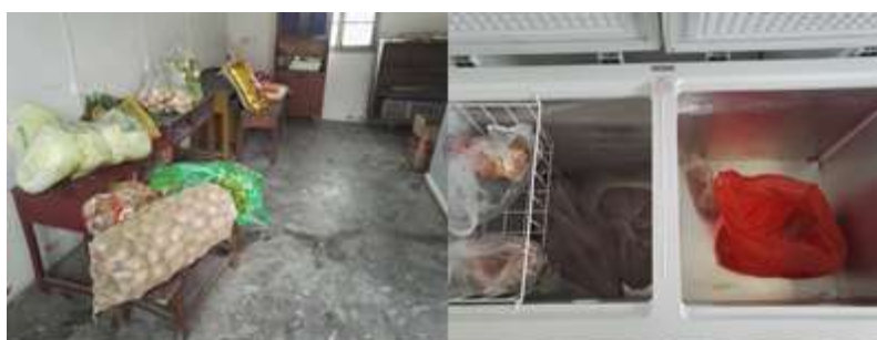
图I-3 食材储存情况组图