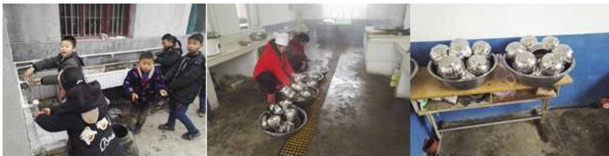
图III-3 餐前洗手与餐具卫生、消毒组图