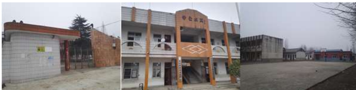
图 2 学校情况组图