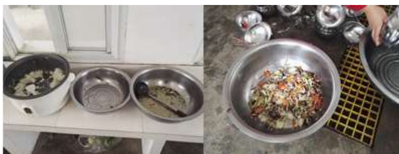
图III-4 剩菜剩饭与餐余组图