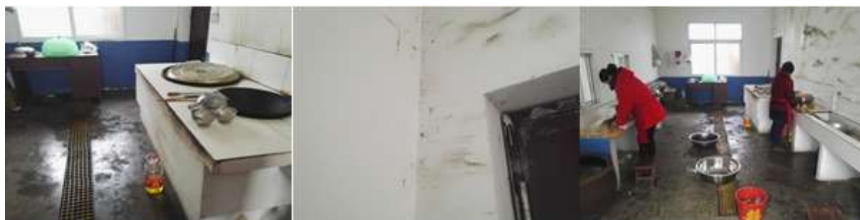
图I-2 厨房操作间及厨师卫生情况组图