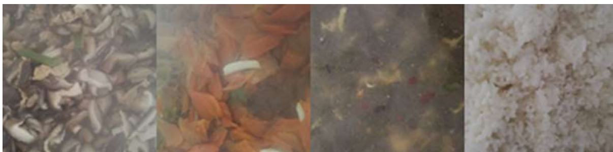
图III-1 开餐当天菜品情况组图