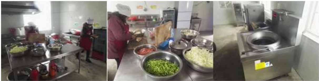
图I-2 厨房操作间及厨师卫生情况组图