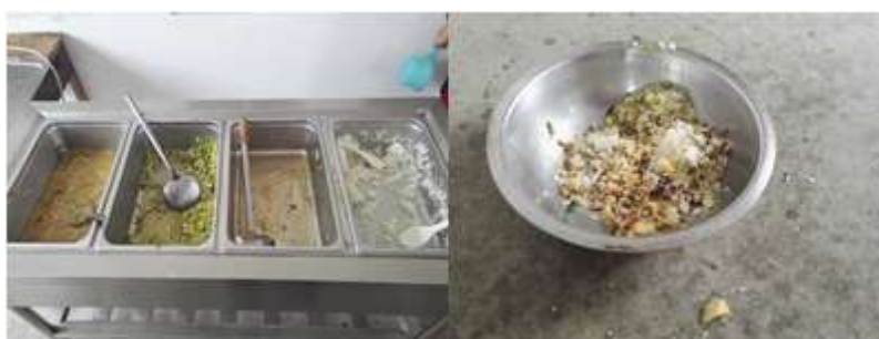
图III-4 剩菜剩饭与餐余组图