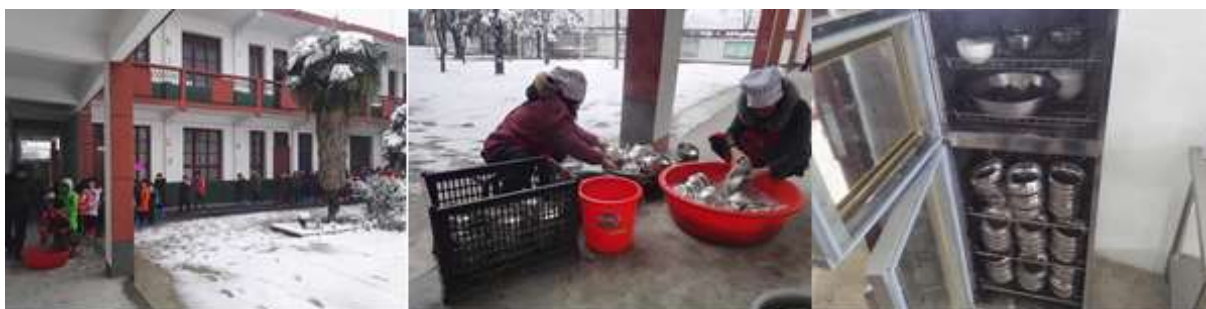
图III-3 餐前洗手与餐具卫生、消毒组图