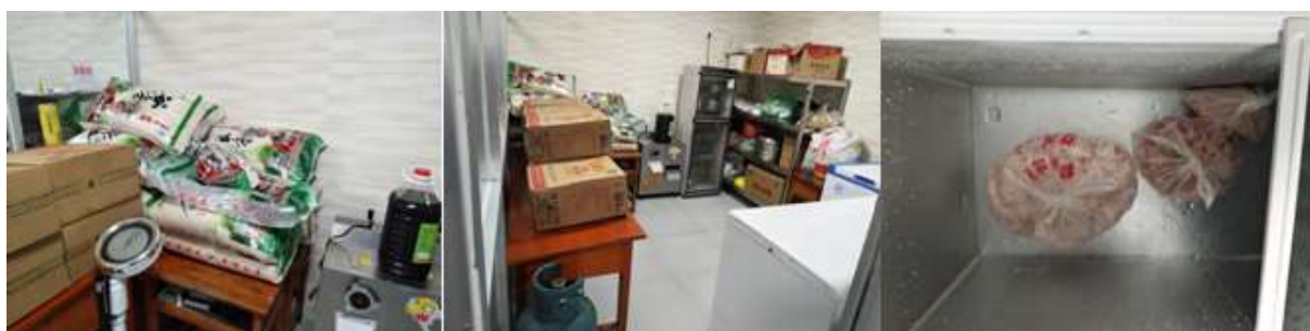
图I-3 食材储存情况组图