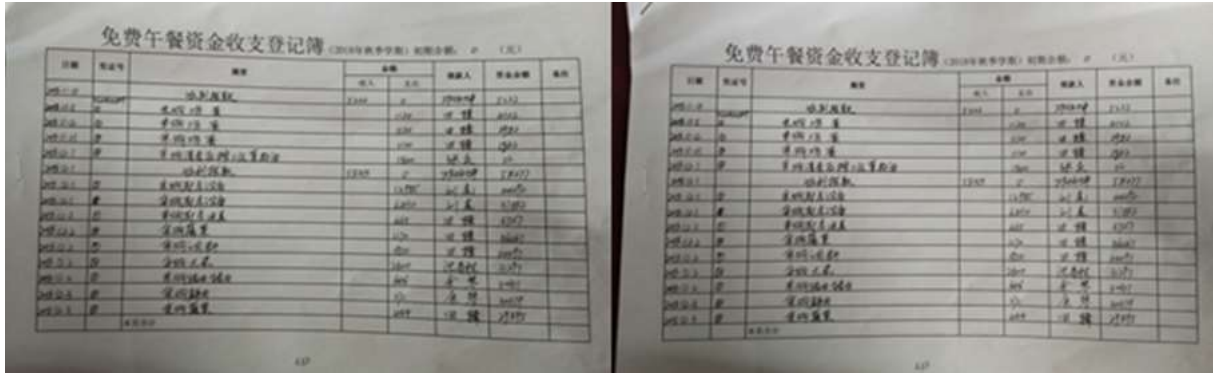
图 II-3 现流水账组图