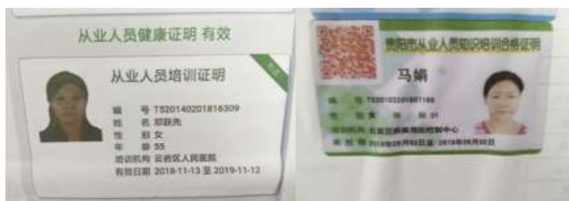
图I-1 厨师健康证组图