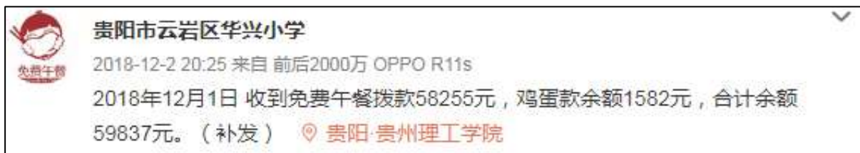
图2 学校微博公示拨款截图