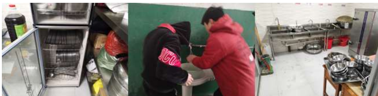
图III-3 就餐卫生情况组图（从左到右分别为餐具消毒、餐前洗手、餐具清洗）