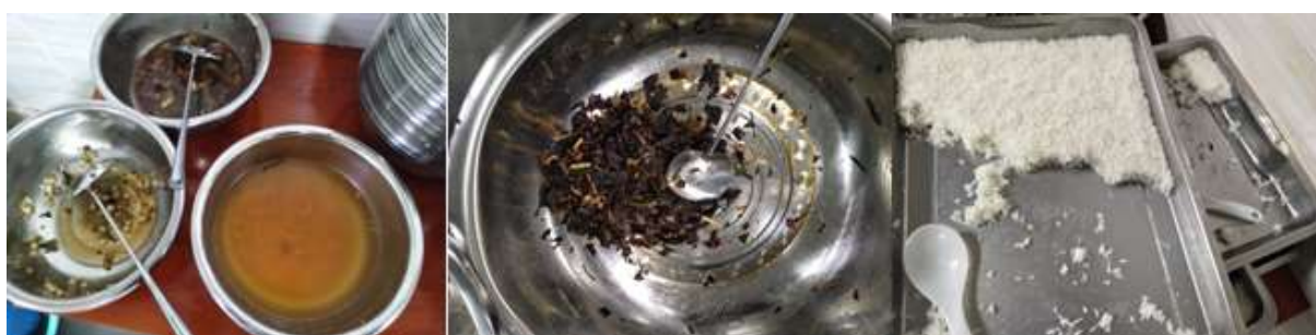
图III-4 餐后浪费情况组图