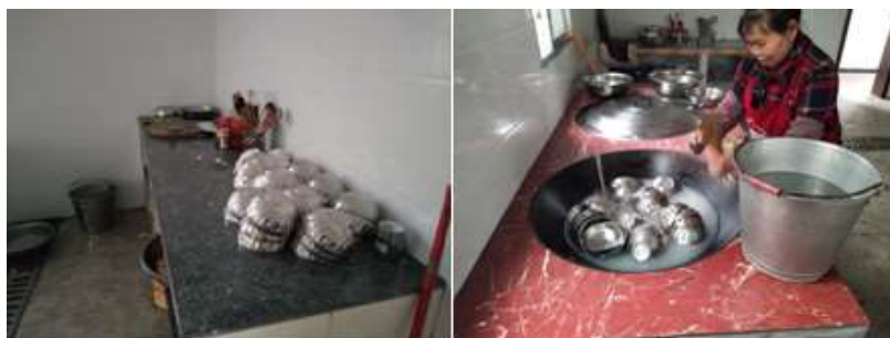
图III-3 就餐卫生情况组图（从左到右分别为餐具消毒、餐具清洗）