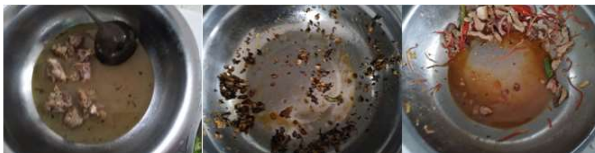
图III-4 餐后浪费情况组图