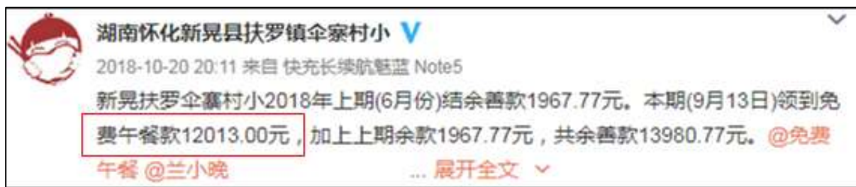
图 2 学校微博公示拨款截图

额分别为 12013 元、8296 元，2018 年 10 月 20 日学校微博公示拨款金额为 12013 元、与实际相符。2018 年 11 月 16 日拨款信息，学校微博未公示。