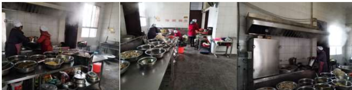
图I-2 厨房卫生情况组图