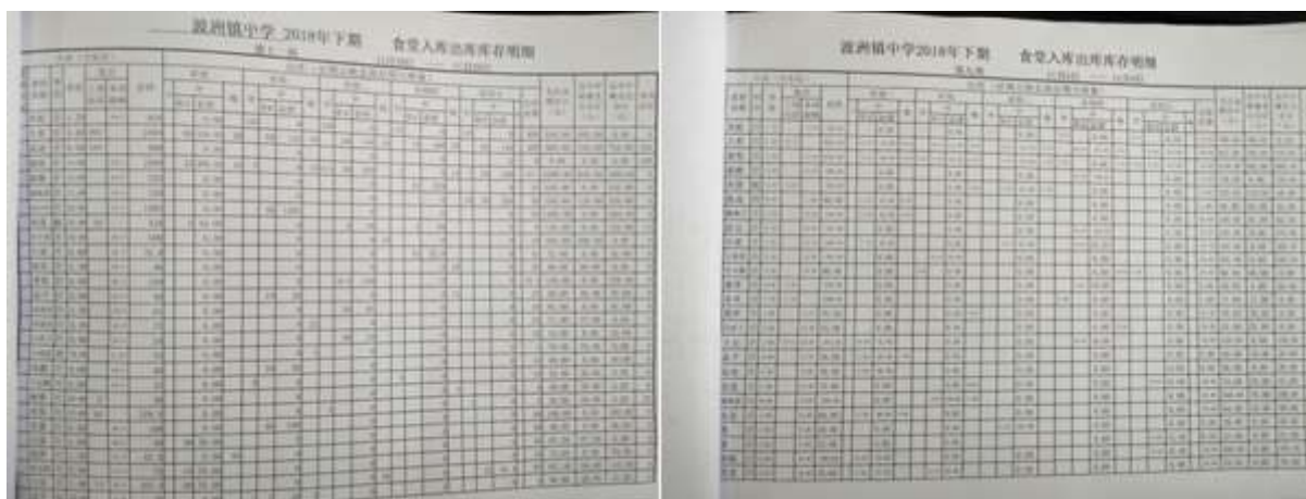
图II-2 出入库登记台账组图