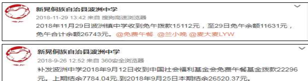
图 2 学校微博公示拨款组图