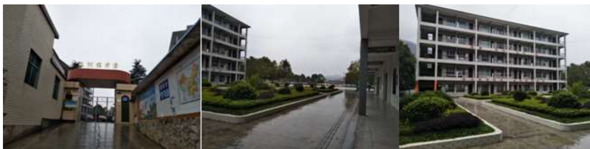
图 3 学校情况组图