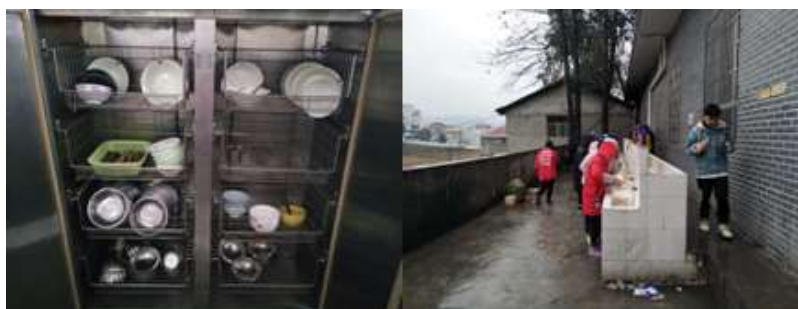
图 III-3 就餐卫生情况组图（从左至右依次为餐具消毒、餐具清洗）