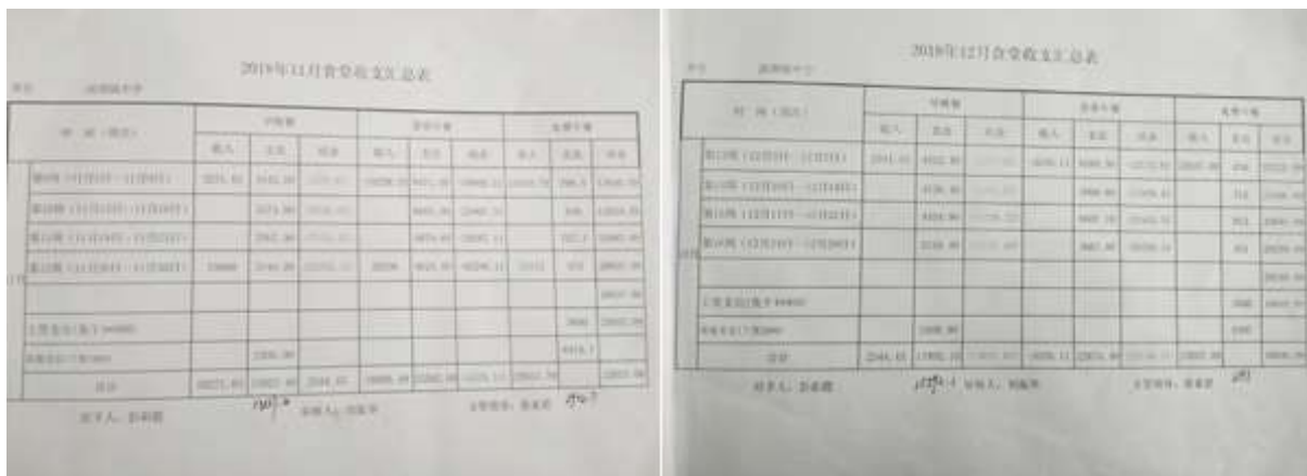
图II-3 现金收支记录组图