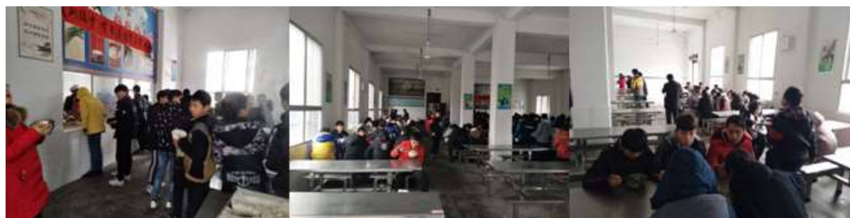
图 III-2 就餐情况组图