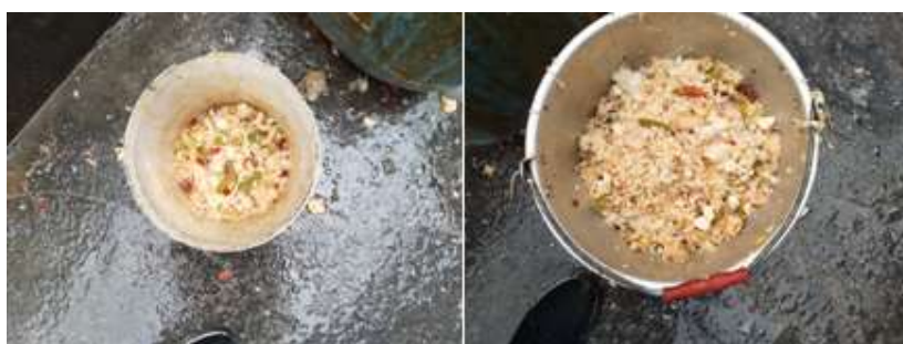
图 III-4 餐后剩余与浪费情况组图