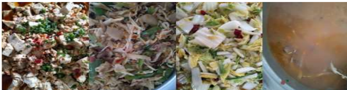
图 III-1 开餐当天菜品情况组图