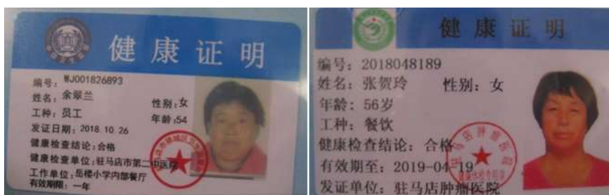
图I-1 厨师健康证组图