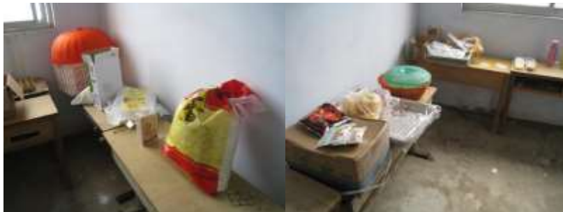
图I-3 食材储存情况组图