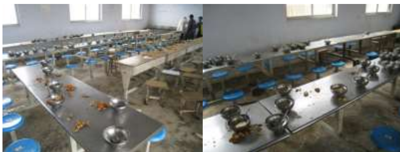
图 4 餐后浪费情况组图

本次现场调查发现，该校的学生浪费情况比较严重，因此在此单列此项做扣分处理，希望引起校方足够重视。