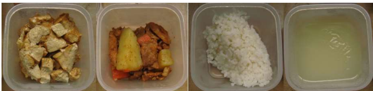
图I-4 食品留样情况组图