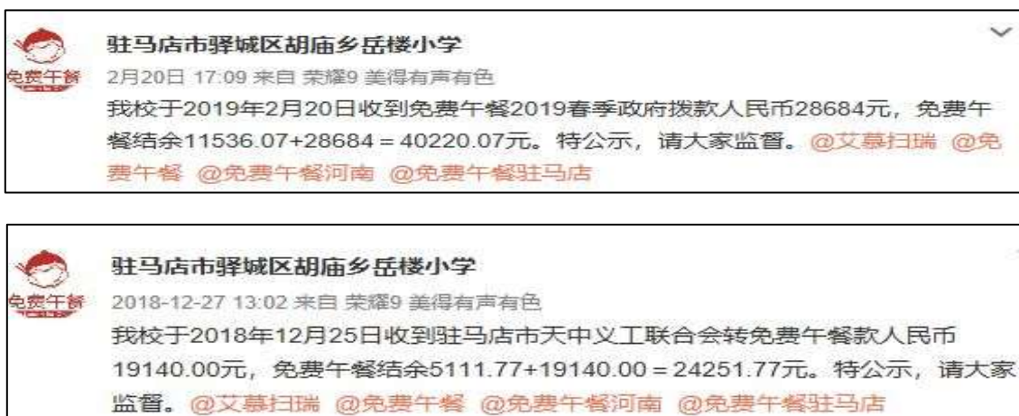
图 2 学校微博公示拨款截图