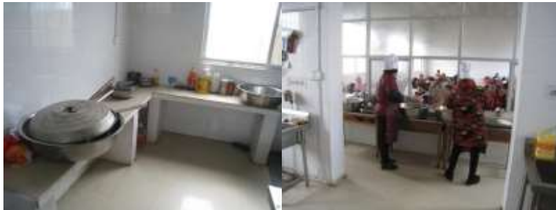
图I-2 厨房及厨师卫生情况组图