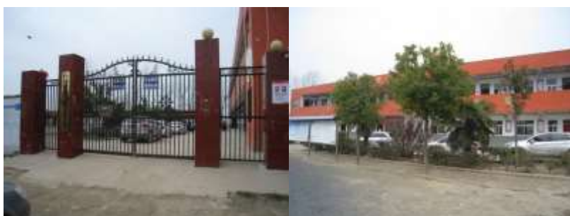
图 3 学校情况组图