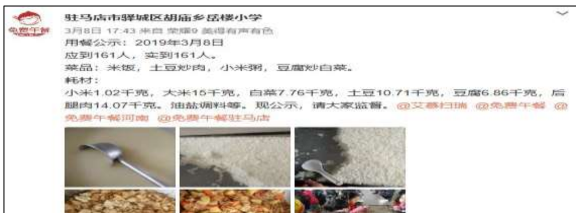
图IV-1 开餐当日微博公示图