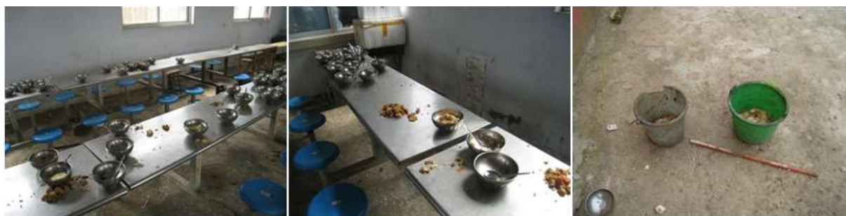
图III-3 餐后剩余情况组图