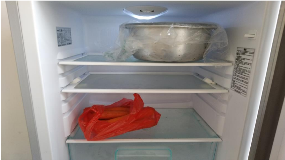
整改后冰箱储藏食物情况