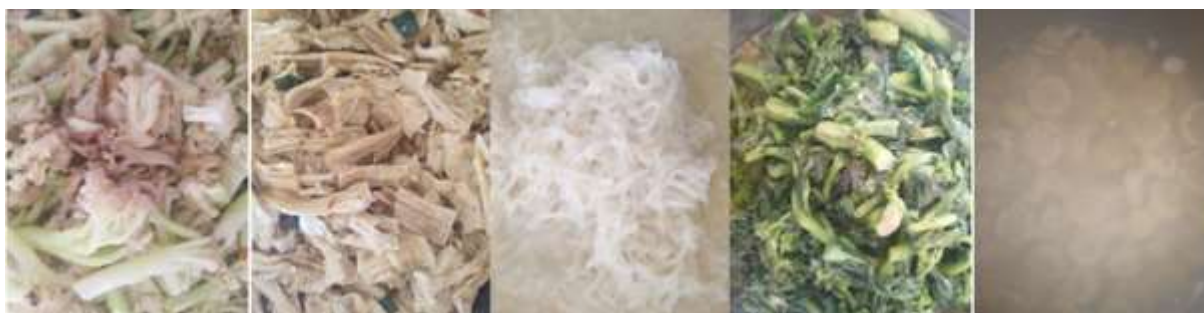
图III-1 开餐当天菜品情况组图