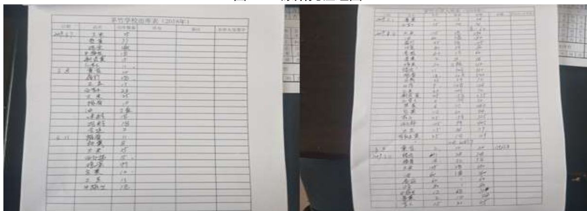
图II-2 出入库记录组图