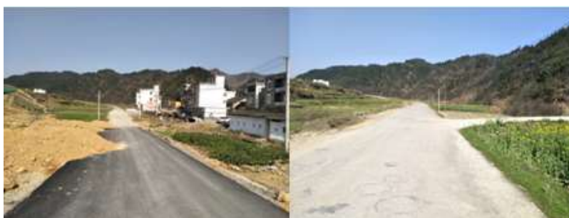
图 1 路况组图

交通说明：前往茅竹小学可在瑞昌城西客运站乘坐肇陈方向的班车到茅竹村村口，再由茅竹村村口步行到茅竹小学，全程由县道组成，路况较好。