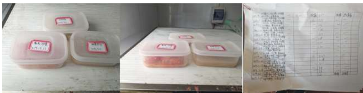
图I-4 食品留样情况组图