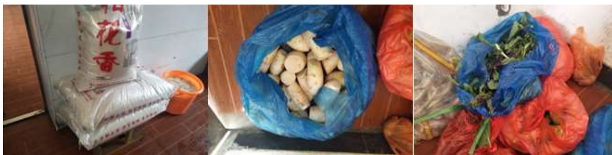
图I-3 食材储存情况组图