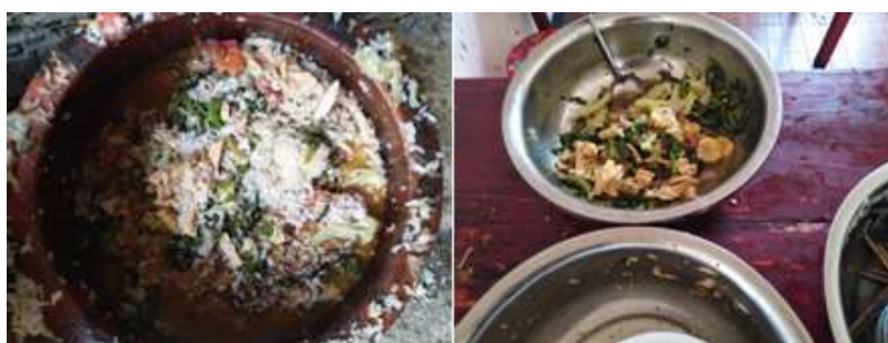
图III-4 餐后剩余情况组图