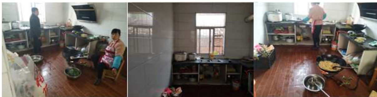
图I-2 厨师、厨房卫生情况组图