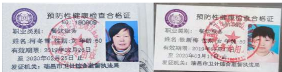
图I-1 厨师健康证组图