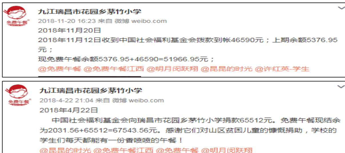
图 2 学校微博公示拨款截图

拨款分别为 65512 元和 46590 元,与实际相符。学校微博公示与官网公示拨款金额一致。