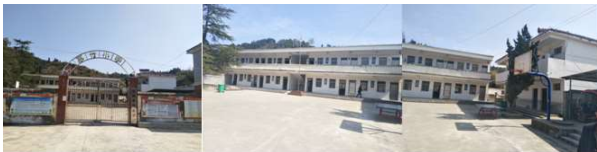
图 3 学校情况组图