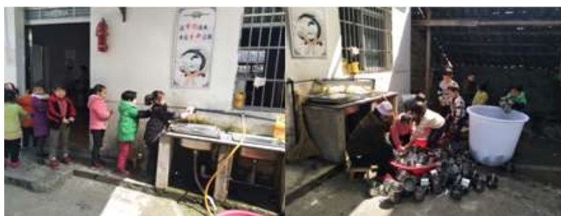
图III-3 就餐卫生情况组图