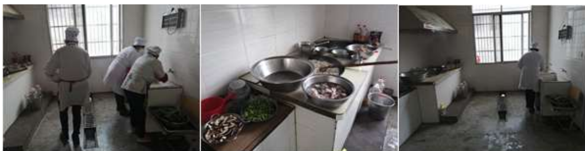
图I-2 厨师、厨房卫生情况组图