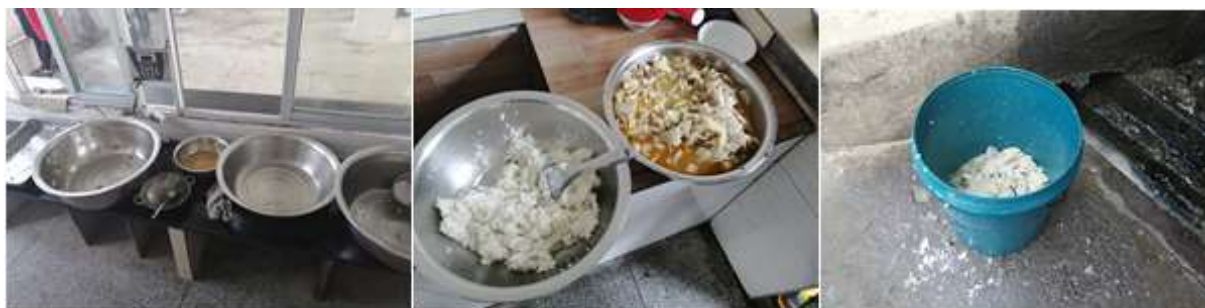
图III-4 剩菜剩饭情况组图