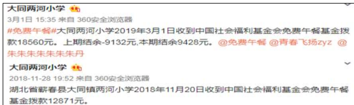
图2 最近两次拨款情况的微博公示截图

说明：2019年3月1日学校收到拨款金额为18560元，并在微博公示拨款情况，但官网还未公示相关拨款情况。