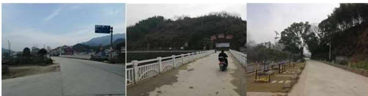
图 1 路况组图

交通说明：自蕲春县城前往两河口，可在蕲春县客运站乘坐前往大同方向的直达流水班车，在两河口下车，再步行2公里到达两河村，班车间隔时间为每15分钟一趟。