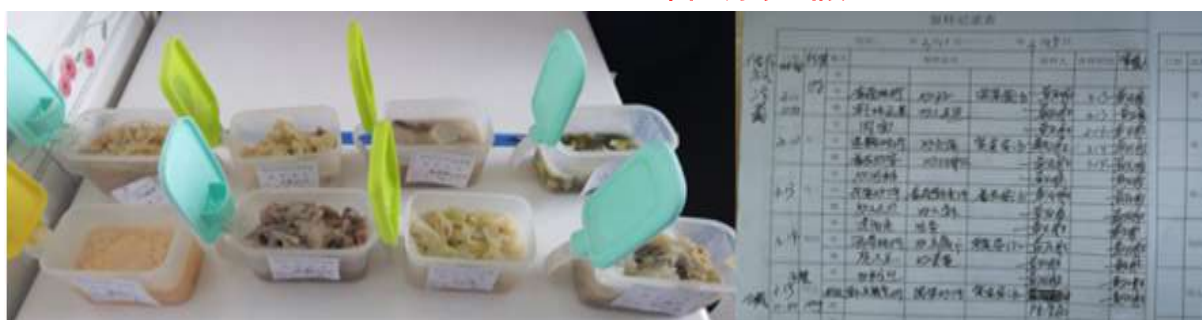
图I-4 食品留样情况组图 (留样记录不完善)