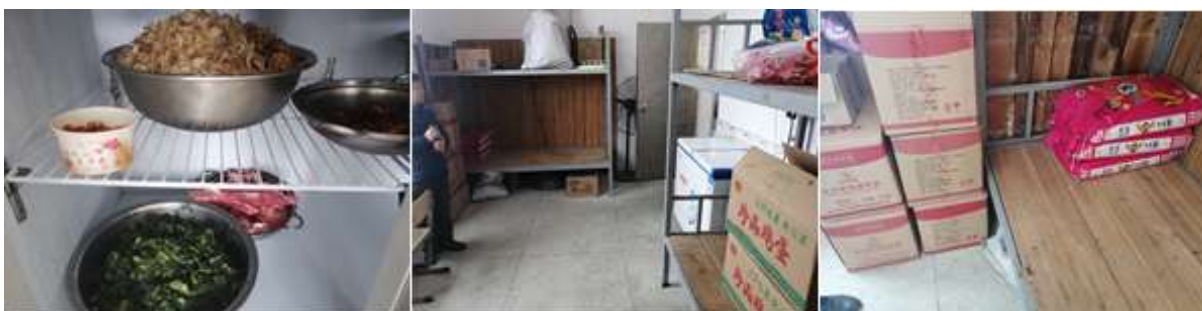
图I-3 食材储存情况组图 (图一为冰柜情况)