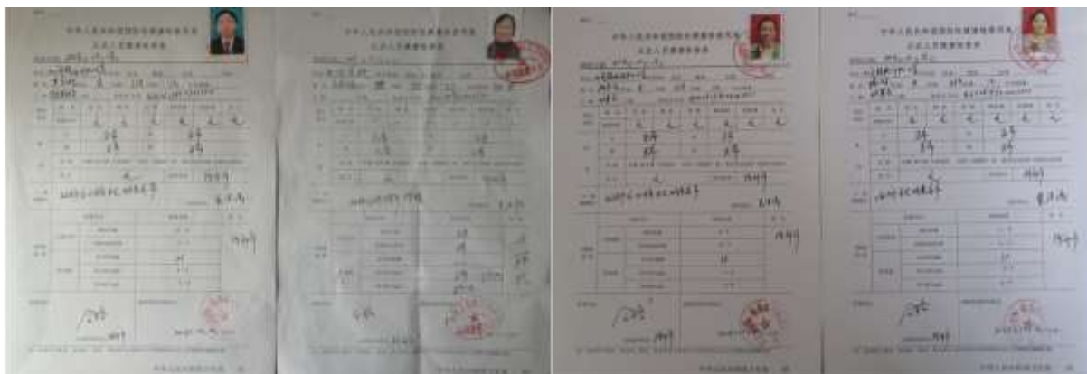
图I-1 厨师健康证组图