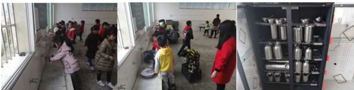
图III-3 就餐卫生情况组图（从左到右依次为餐前洗手、餐具消毒）