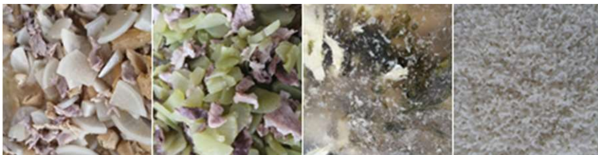
图III-1 开餐当天菜品情况组图