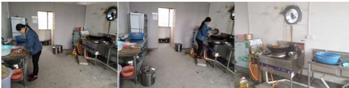
图I-2 厨师、厨房卫生情况组图