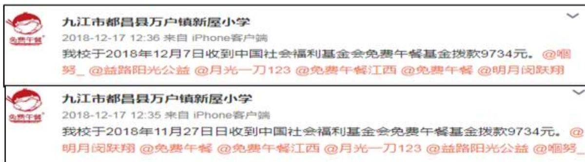
图 2 学校微博公示拨款截图