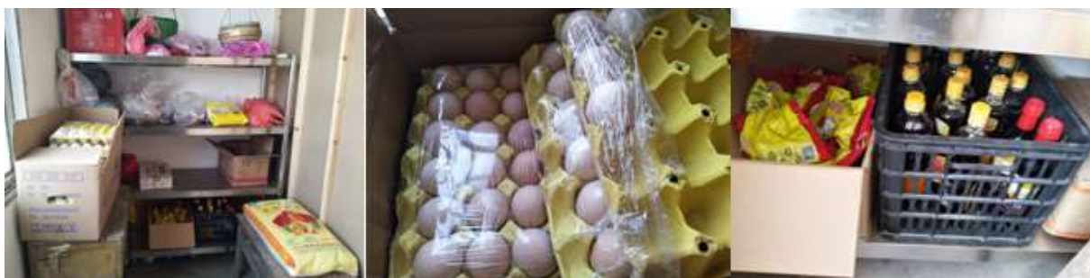
图I-3 食材储存情况组图