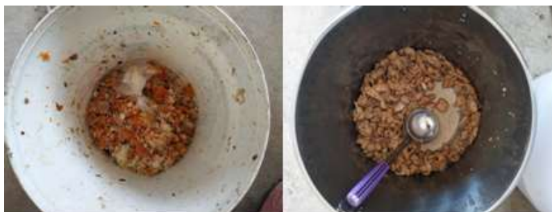
图III-4 餐后剩余情况组图