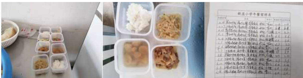
图I-4 食品留样情况组图