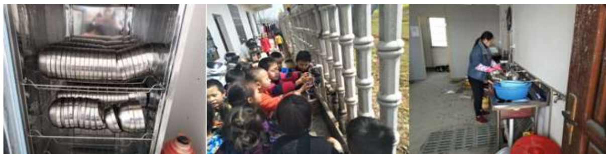
图III-3 就餐卫生情况组图（从左到右分别为餐具消毒、餐前洗手、餐具清洗）