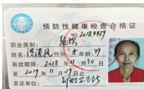
图I-1 厨师健康证组图