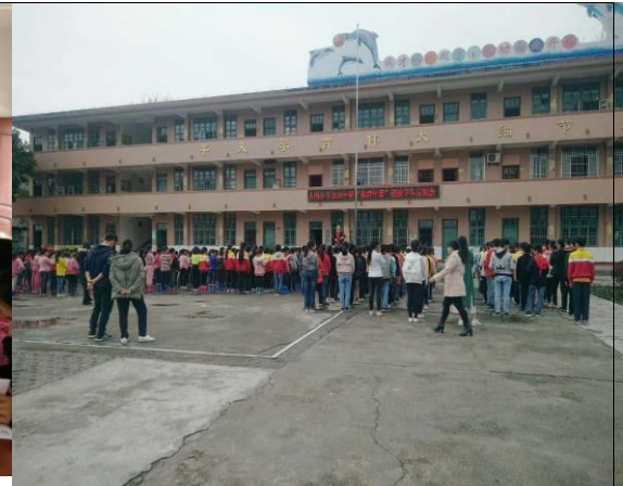
分别召开教师、学生“免费午餐项目稽查反馈会”。