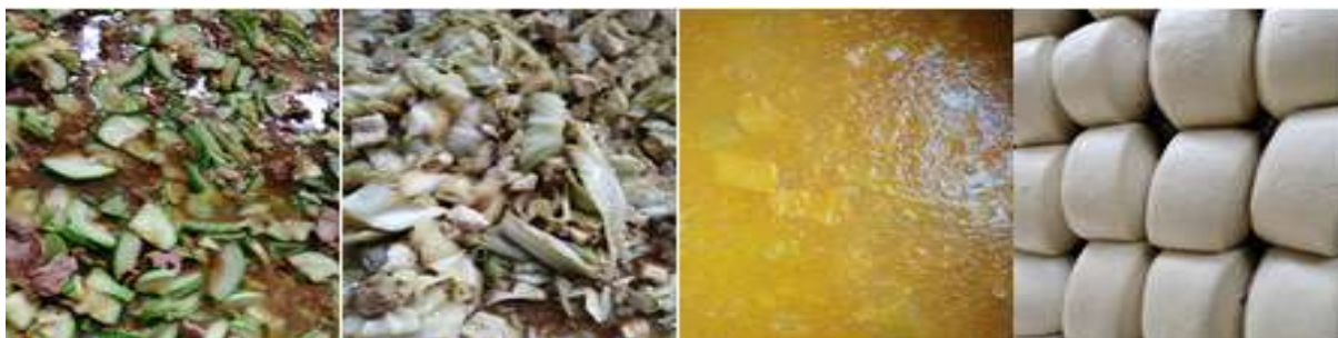
图III-1 开餐当天菜品情况组图