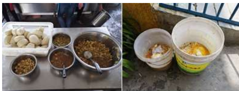
图III-4 餐后厨余情况组图