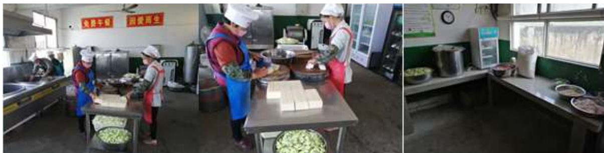
图I-2 厨师、厨房卫生情况组图