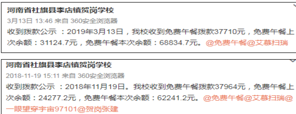
图 2 最近两次拨款情况的微博公示截图