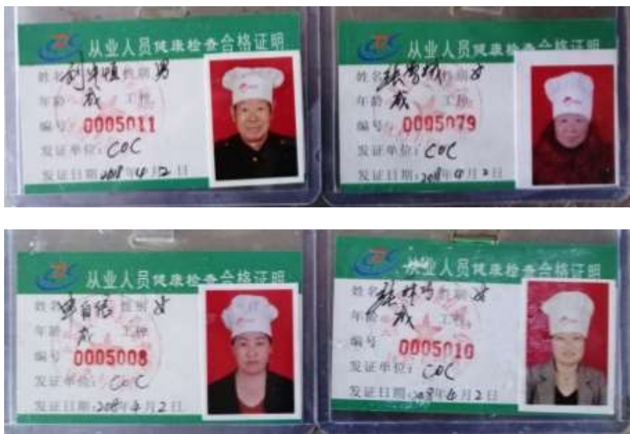
图I-1 厨师健康证组图