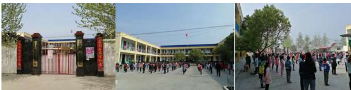
图 3 学校情况组图