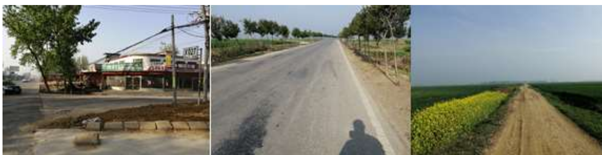
图 1 路况组图

交通说明：自社旗县前往贺岗村，可在社旗县客运站乘坐前往李店方向的班车，在草庙王路口下车，再步行3公里即到达贺岗学校。