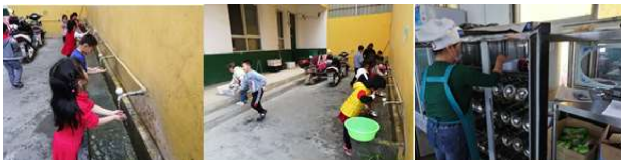
图III-3 就餐卫生情况组图（从左到右依次为餐前洗手、餐具消毒）