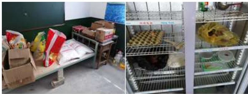
图I-3 食材储存情况组图