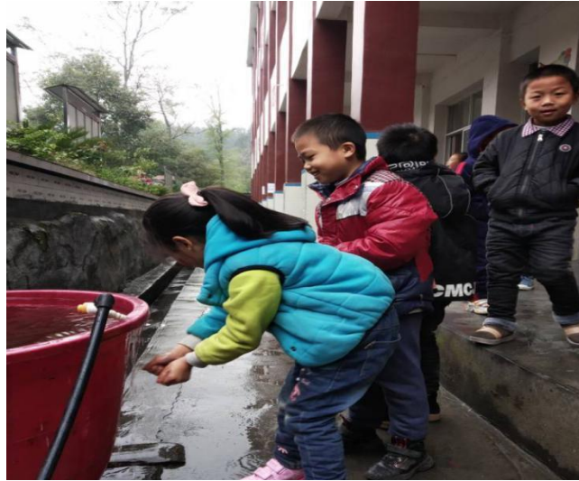
学生餐前排队统一洗手后就餐