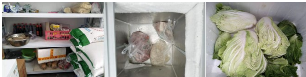
图I-3 食材储藏情况组图