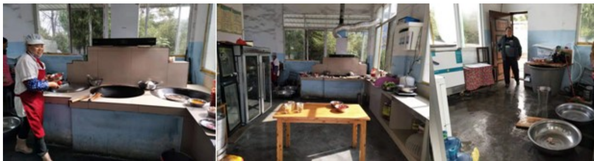
图I-2 厨师、厨房卫生情况组图