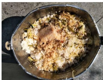
图III-4 餐后剩余情况图