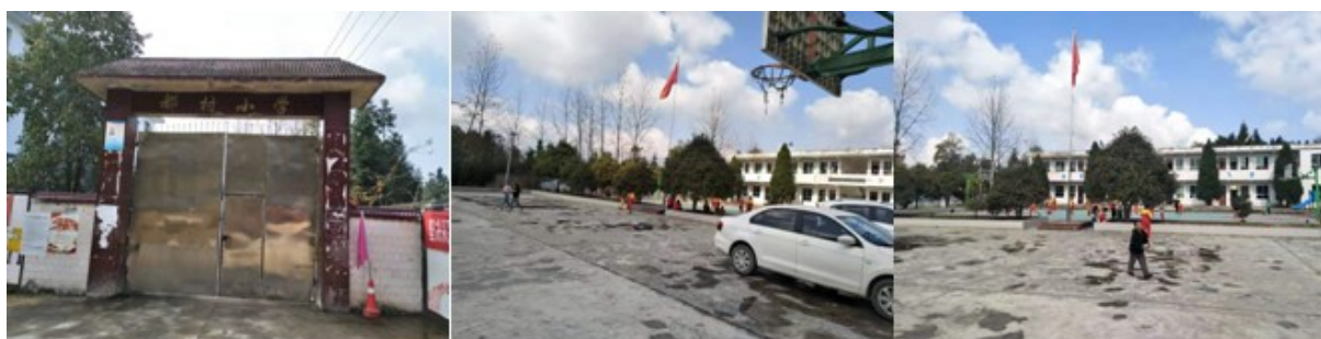
图 3 学校情况组图