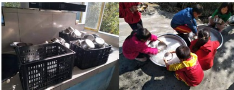
图III-3 就餐卫生情况组图