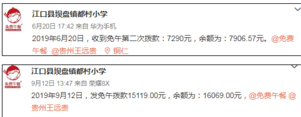
图 2 微博公示拨款截图

说明：2019年6月11日和2019年9月4日官网公示已经拨款，官网公示拨款金额分别为7290元和15119元，微博公示拨款分别为7290元和15119元，与实际相符。学校微博公示与官网公示拨款金额一致。