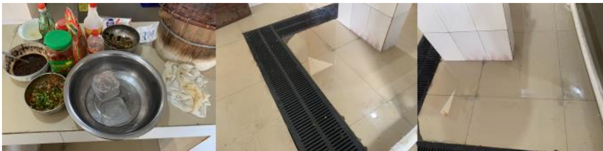
图 I-2 厨师、厨房卫生情况组图（地面有大滩积水）