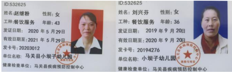
图 I-1 厨师健康证组图