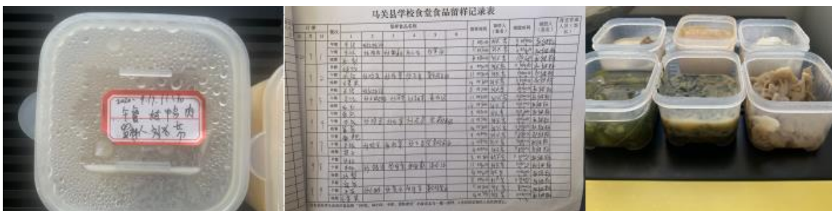
图 I-4 食品留样情况组图（留样量不足 125 克，留样缺少 9 月 9 日后的记录）