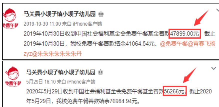
图 2 拨款公示截图

说明：2020 年 5 月 8 日和 2019 年 10 月 24 日官网公示已经拨款，官网公示拨款金额分别为 56266 元和 47899 元。学校于 2020 年 5 月 29 日和 2019 年 10 月 24 日公示拨款金额分别为 56266 元和 47899 元，与实际相符，学校微博公示与官网公示拨款金额一致。