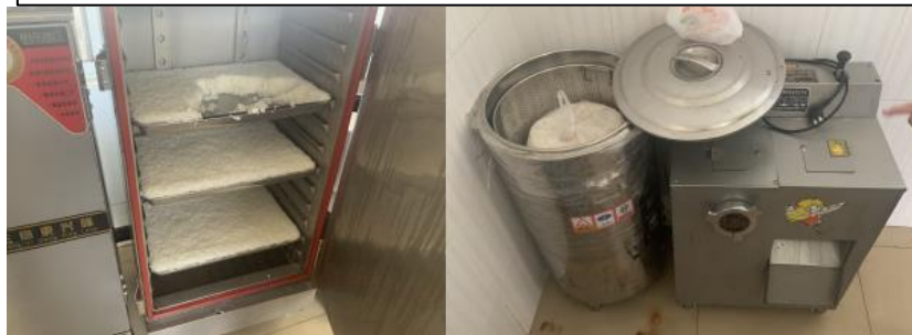
配套采购及部分配套设备微博截图（24层蒸饭柜和闲置的煮面炉）