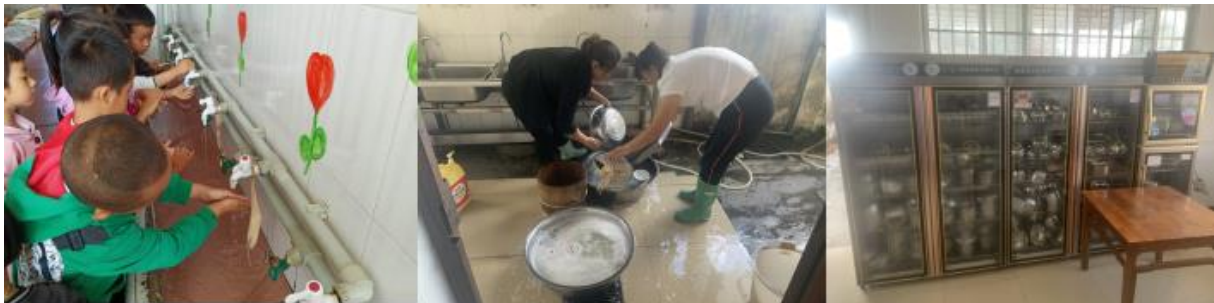
图III-3 就餐卫生情况组图（从左到右依次为餐前洗手、餐后餐具清洗、统一消毒）