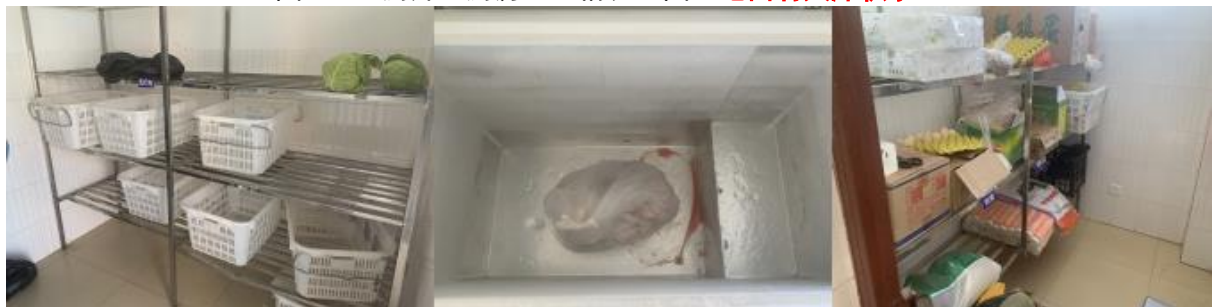
图 I-3 食材储存情况组图（冰柜底部血水结冰）