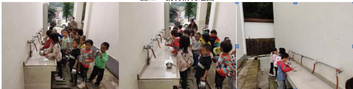
图III-3 就餐卫生情况组图（从左到右依次为餐前洗手、餐具清洗）