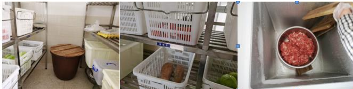
图 I -3 食材储存情况组图