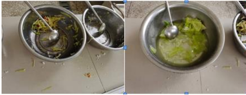
图III-4 午餐部分剩余组图