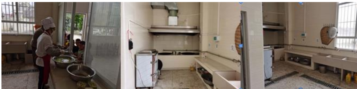
图 I -2 厨师、厨房卫生情况组图