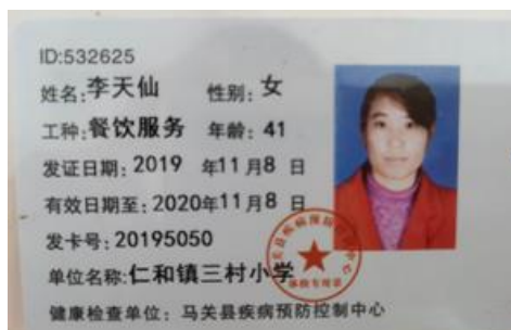
图 I -1 厨师健康证情况图