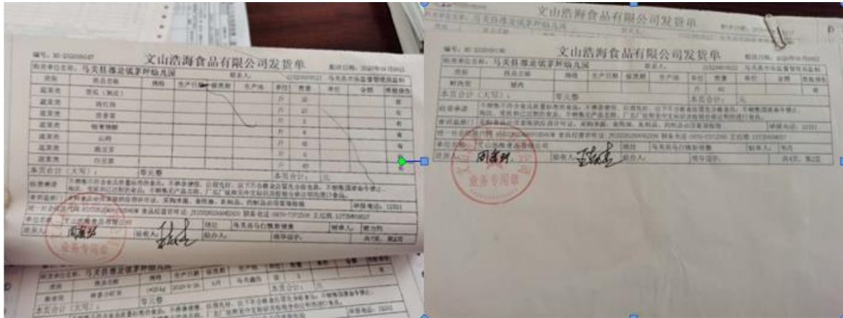
图 II-1 原始凭证组图