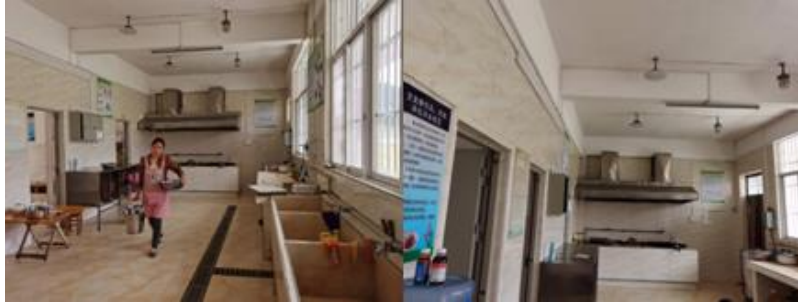
图 I -2 厨师、厨房卫生情况组图