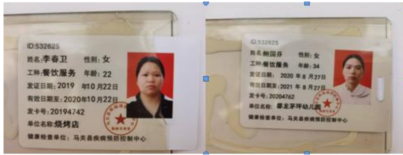
图 I -1 厨师健康证情况图