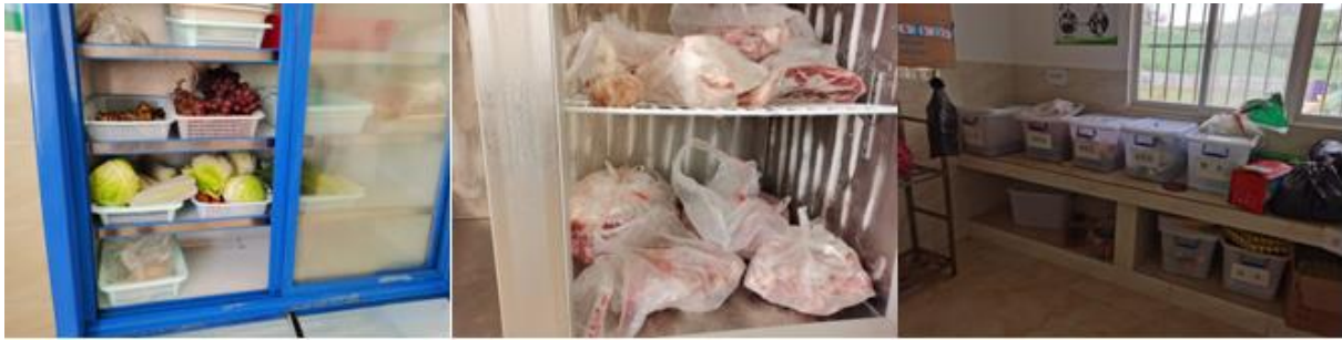
图 I -3 食材储存情况组图