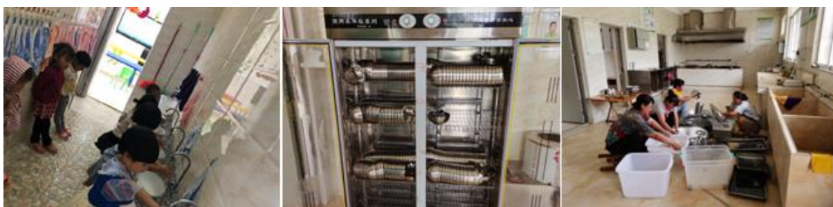
图III-3 就餐卫生情况组图（从左到右依次为餐前洗手、餐具消毒、餐具清洗）