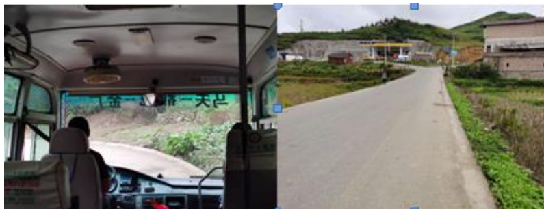
图 1 路况组图

交通说明：由马关县前往茅坪幼儿园可在马关县汽车站乘坐前往都龙方向的班车，在都龙镇下车后乘坐前往金厂方向的班车，在茅坪幼儿园下车即可。学校就在公路边，全程为省道和县道，马关到都龙方向路况良好，都龙到金厂方向因在修路，路况较差且易堵车。