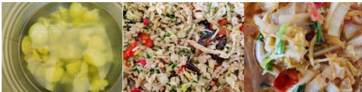
图III-1 开餐当天菜品情况组图