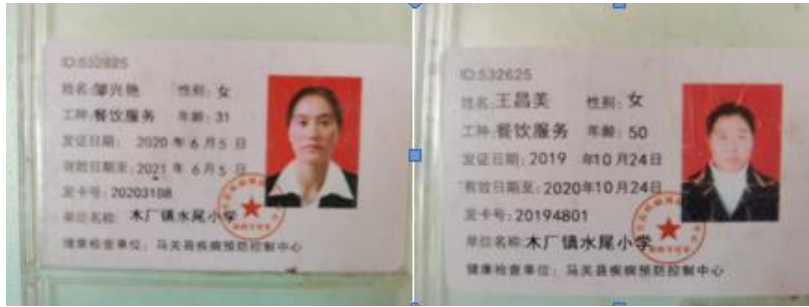
图 I -1 厨师健康证情况图