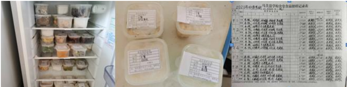
图 I -4 食品留样情况组图