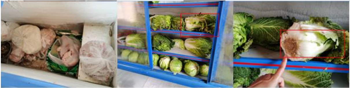
图 I -3 食材储存情况组图