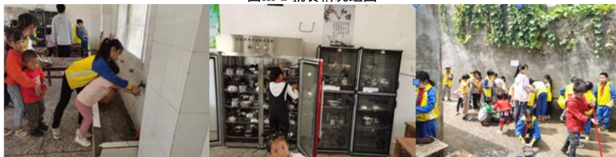
图III-3 就餐卫生情况组图（从左到右依次为餐前洗手、餐具消毒、餐具清洗）