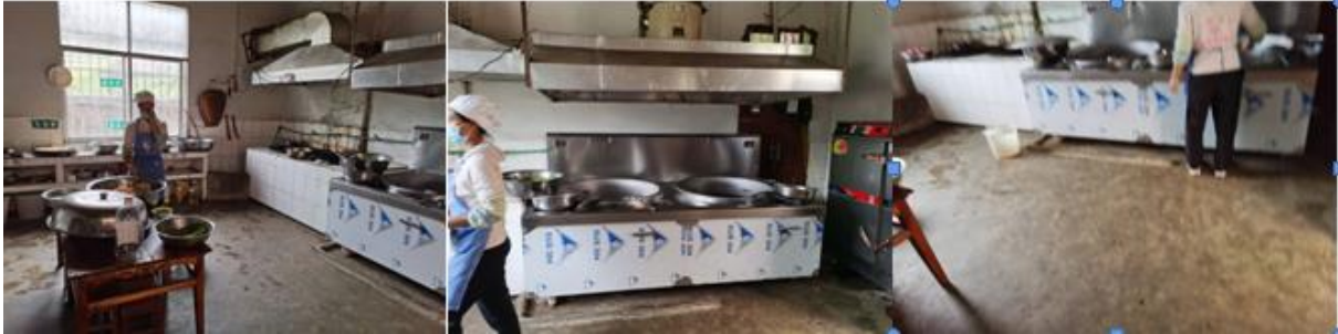
图 I -2 厨师、厨房卫生情况组图