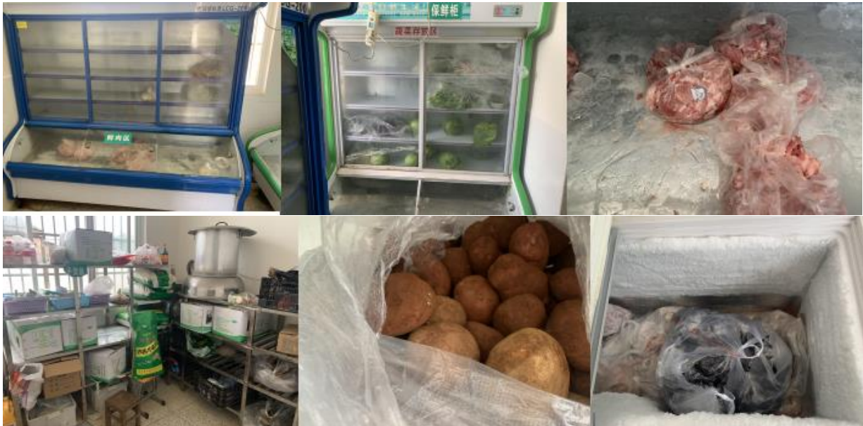
图 I -3 食材储存情况组图 (冰柜底部有血水结冰且厚结冰霜)