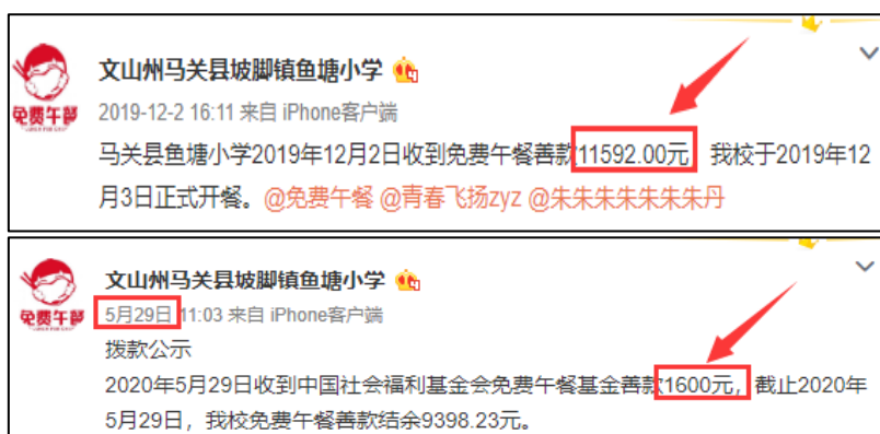
图 2 拨款公示截图

说明：查阅官网拨款信息，免费午餐基金分别于 2020 年 6 月 5 日拨款 1600 元和 2019 年 11 月 28 日拨款 11592 元，学校分别于 2020 年 5 月 29 日和 2019 年 12 月 2 日对两笔拨款进行了公示，金额一致。