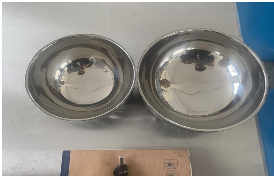
配套采购及部分餐碗闲置微博截图（前后批次碗）