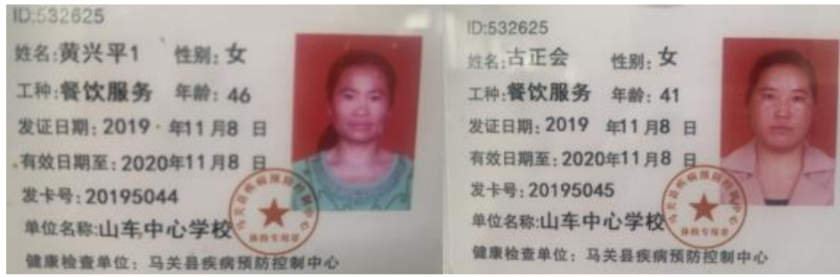
图 I -1 厨师健康证组图