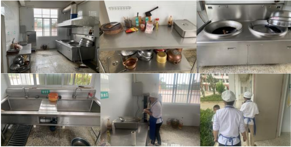
图 I -2 厨师、厨房卫生情况组图 (厨师都未佩戴口罩和 1 人佩戴耳环)