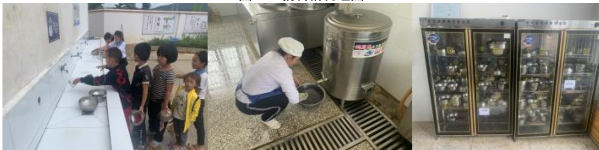
图III-3 就餐卫生情况组图（从左到右依次为餐前洗手、餐后餐具清洗、统一消毒）