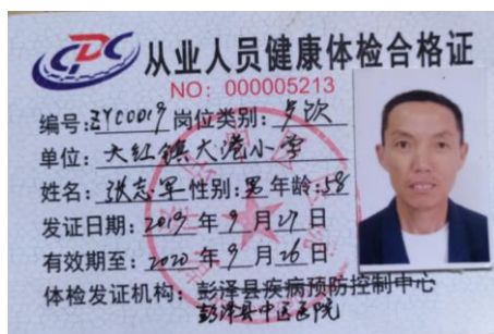
图 I -1 厨师健康证情况图（稽核当天健康证未过期，且学校已说明要办理）