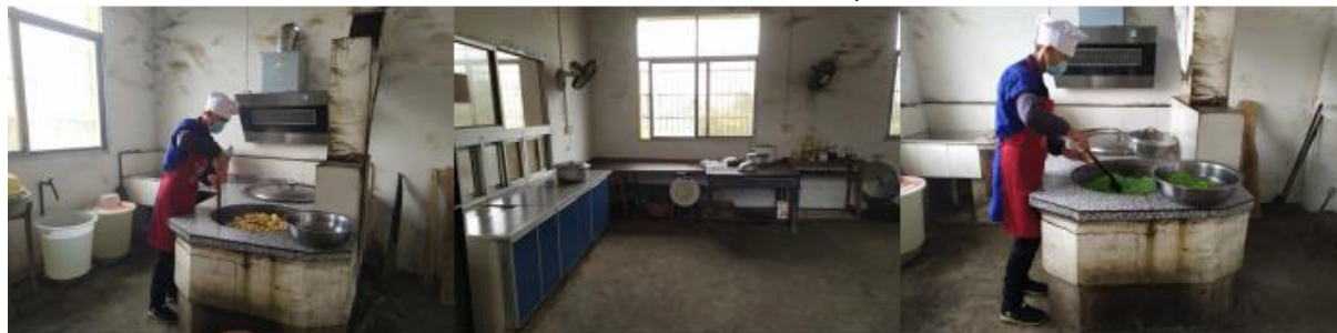
图 I -2 厨师、厨房卫生情况组图