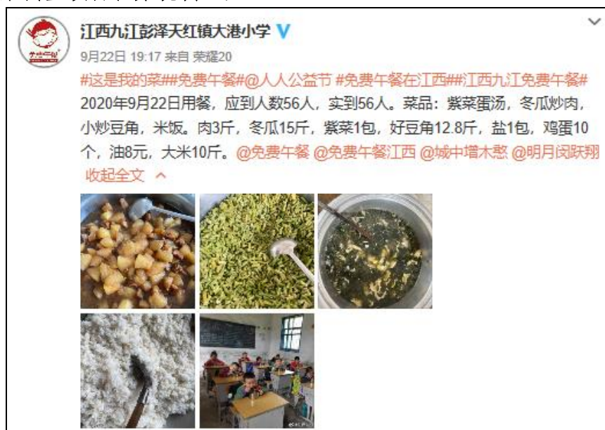
图IV-1 开餐当日微博截图