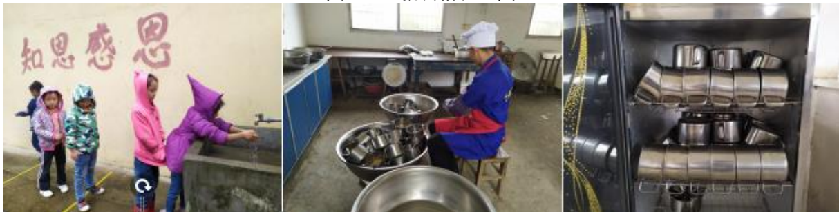
图III-3 就餐卫生情况组图（从左到右依次为餐前洗手、餐具清洗、餐后消毒）