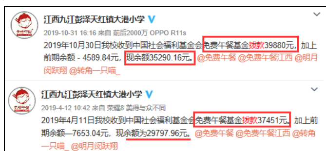
图 2 拨款公示情况截图

说明: 查阅官网拨款信息, 分别于 2019 年 10 月 15 日拨款 39880 元和 2019 年 3 月 13 日拨款 37451 元, 学校分别于 2019 年 10 月 31 日和 2019 年 4 月 12 日对两笔拨款进行了公示, 金额一致。