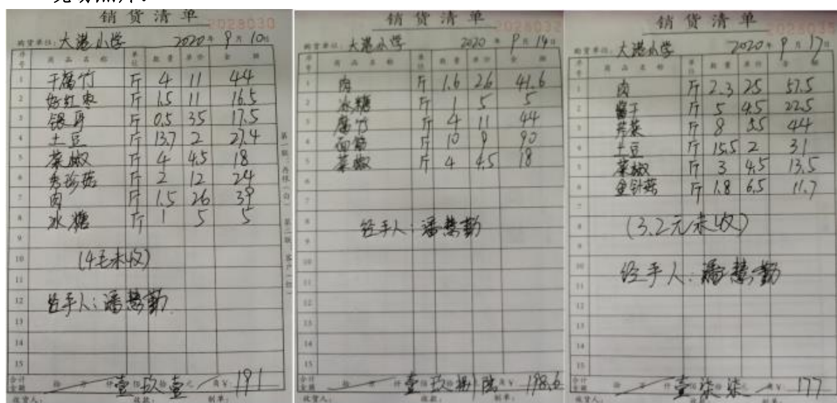
图 II-1 原始凭证组图