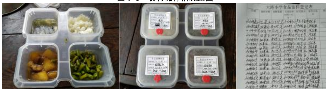
图 I -4 食品留样情况组图