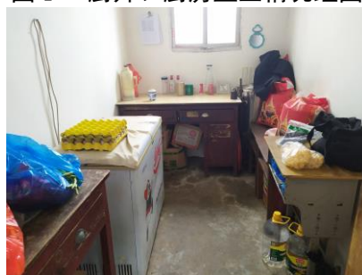
图 I -3 食材储存情况组图