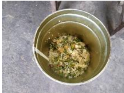
图III-4 餐后剩余情况图（少量）