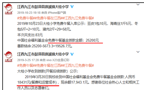
图2 拨款公示情况截图

说明：查阅官网拨款信息，免费午餐基金分别于2019年10月15日拨款25200元和2019年3月13日拨款18431元，学校分别于2019年10月23日和2019年3月25日对两笔拨款进行了公示，金额一致。