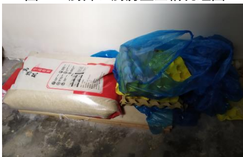
图 I -3 食材储存情况组图