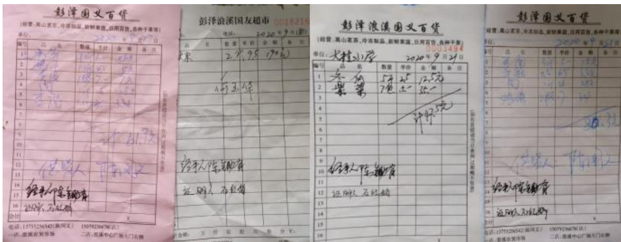
图 II-1 原始凭证组图