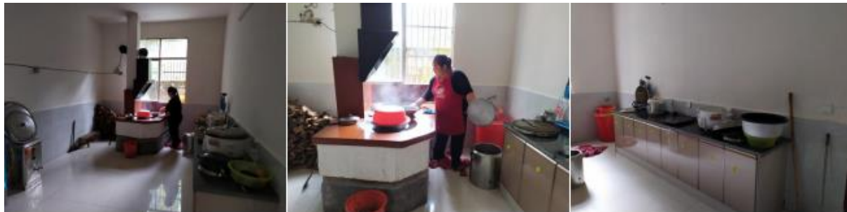
图 I -2 厨师、厨房卫生情况组图