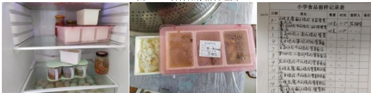
图 I -4 食品留样情况组图