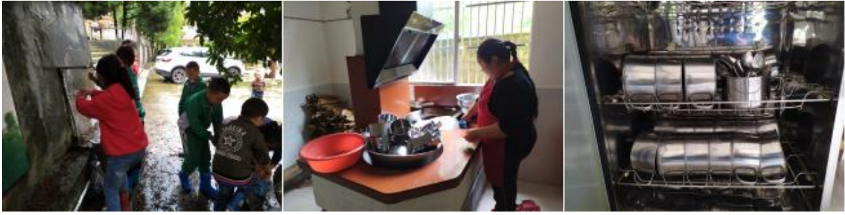
图III-3 就餐卫生情况组图（从左到右依次为餐前洗手、餐具清洗、餐后消毒）