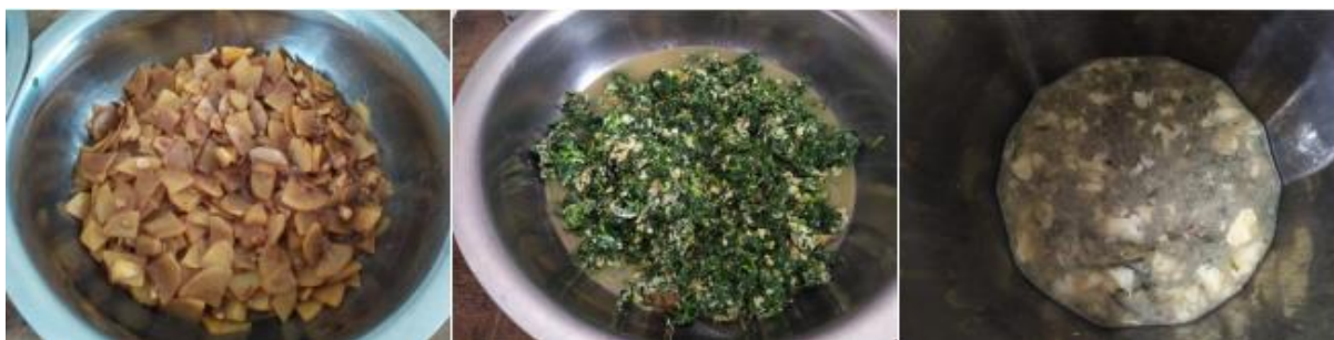
图III-1 开餐当天菜品情况组图