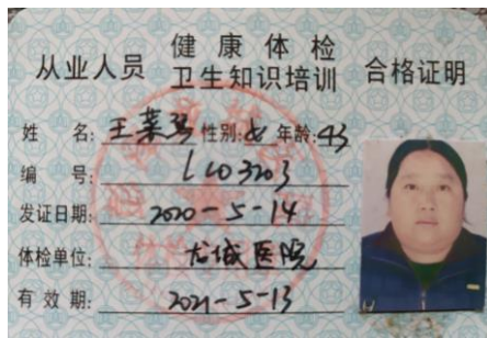
图 I -1 厨师健康证情况图