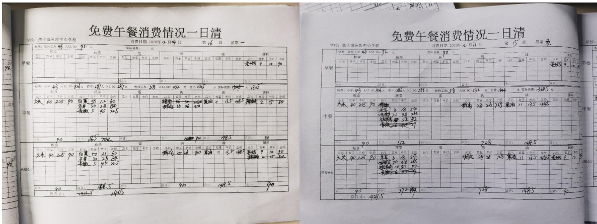
图 II-3 出库记录截图