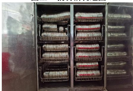
图III-3 餐具卫生情况组图