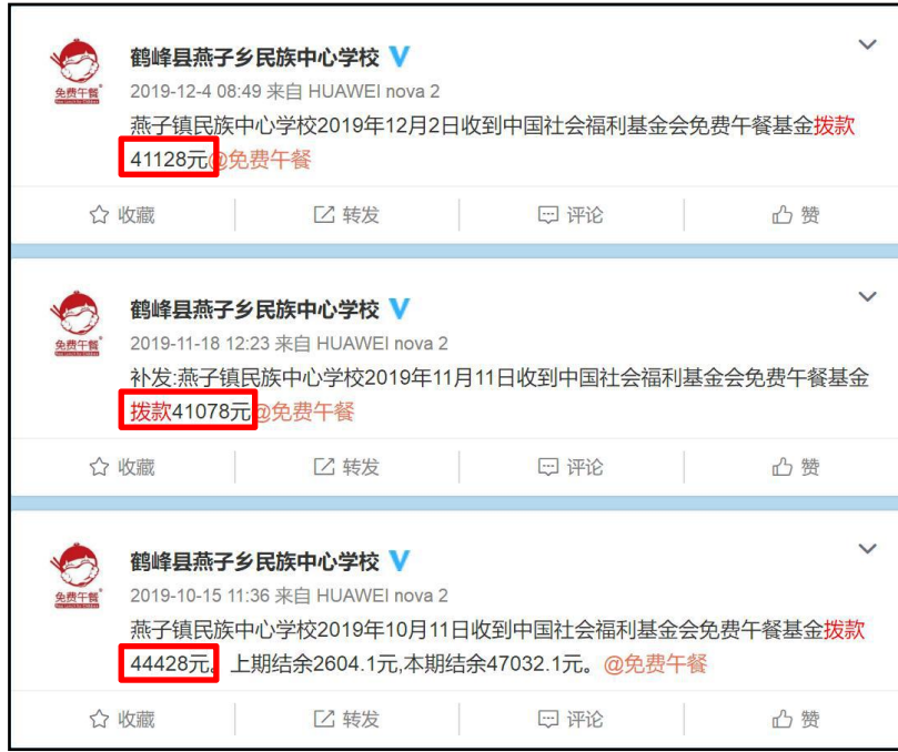
图 2 拨款公示截图