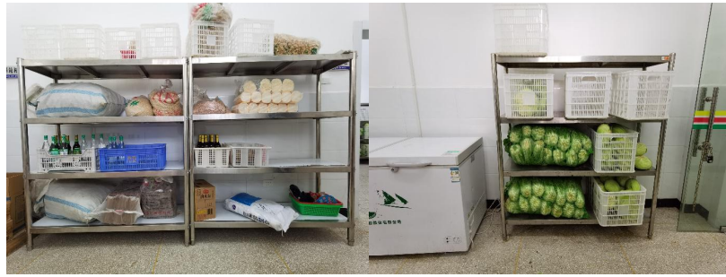
图 I -3 食材仓储情况组图