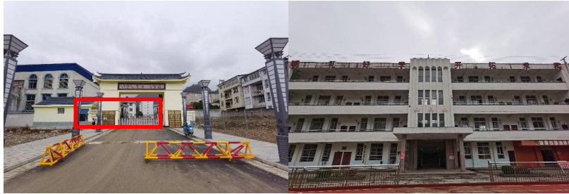
图 3 学校大门及校园环境