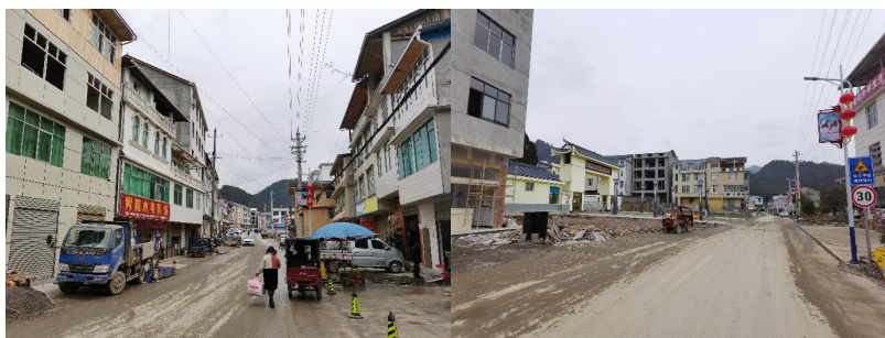
图 1 学校周边街景组图

交通说明：鹤峰县燕子镇民族中心学校位于鹤峰县内燕子镇大街旁，从县城出发需前往益通汽车客运站对面的面包车停靠站乘坐前往燕子镇的面包车。该线路面包车人满即走，无固定发车时间（建议后续安排稽核/探访提早出发），车费单程10元一人，车程约50分钟，下车后步行约5分钟即到达该校。