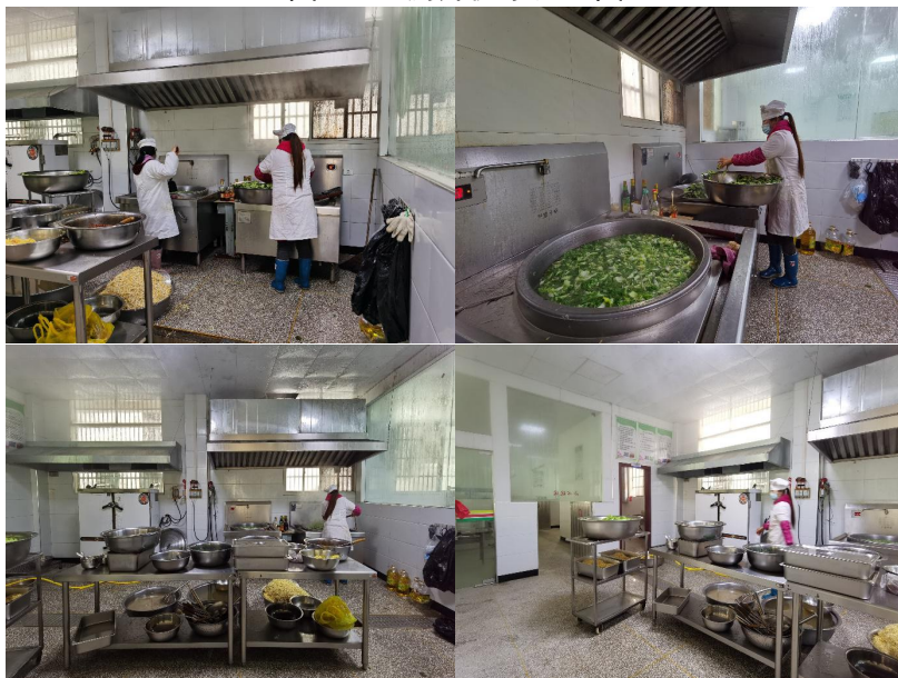
图 I -2 厨房及厨师卫生情况组图