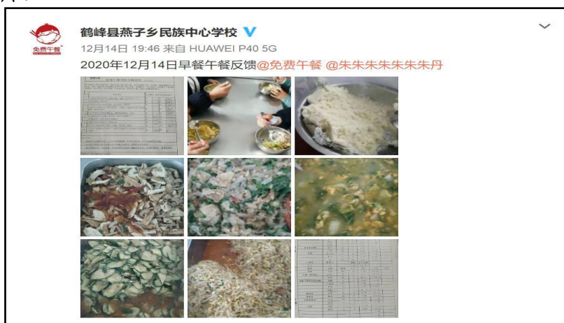
图IV-1 稽核当日用餐公示微博截图