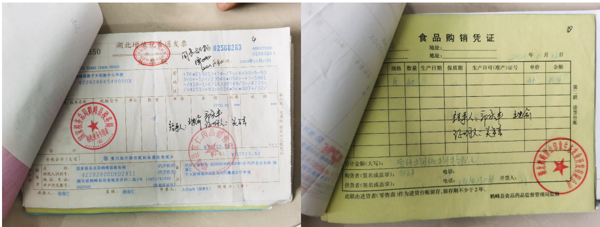
图 II-1 采购原始凭证组图