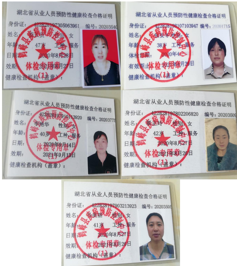
图 I -1 厨师健康证组图