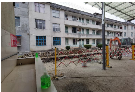
图III-4 学生洗手处施工情况图