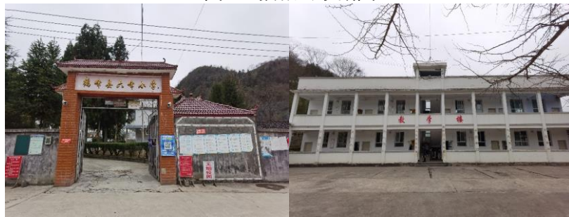
图3 学校大门及校园环境