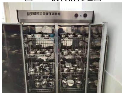
图III-3 餐具卫生情况图