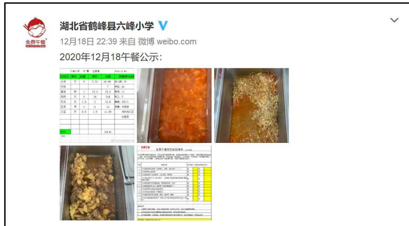
图IV-1 稽核当日用餐公示微博截图