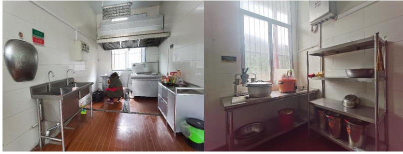
图 I -2 厨房及厨师卫生情况组图