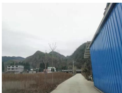
图1 学校周边街景图

交通说明：从县城出发需前往益通汽车客运站对面的面包车停靠站乘坐前往走马或者五里的客运班车，到达五里乡后转乘五里-下洞的客运班车，在六峰下车。县城-走马线路客运班车首班发车时间为7:30，约1小时一班，车费单程25元一人，车程约100-120分钟；五里-下洞线路客运班车发车时间为10:30，车程约60分钟。下车后步行至该校。