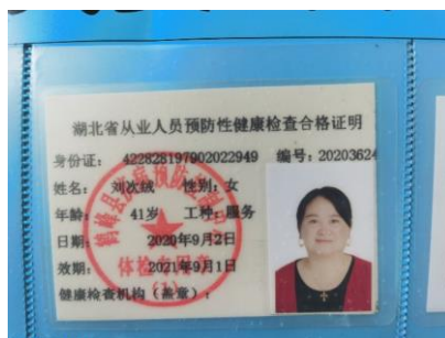
图 I -1 厨师健康证组图