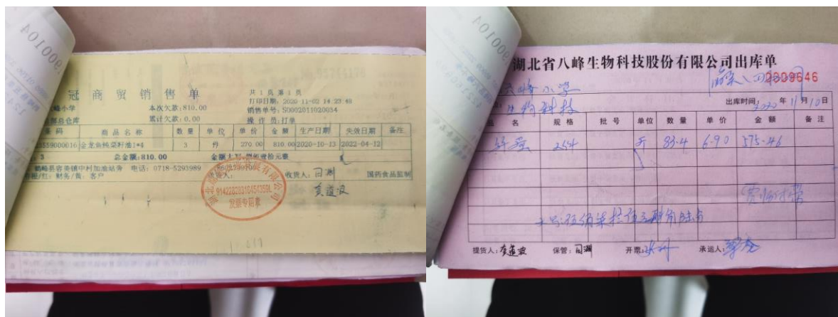
图 II-1 采购原始凭证组图