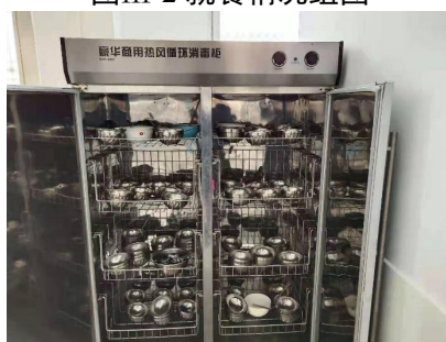
图III-3 餐具卫生情况图