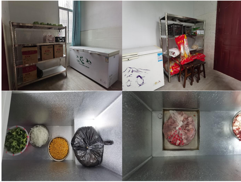
图 I -3 食材仓储情况组图