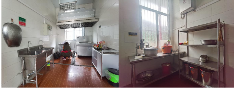
图 I -2 厨房及厨师卫生情况组图