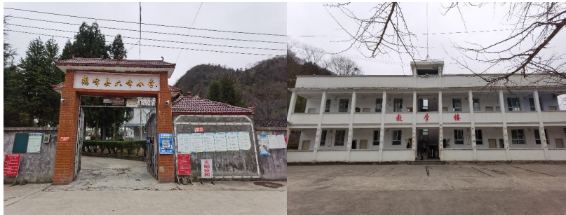
图3 学校大门及校园环境