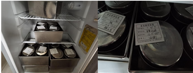
图 I -4 食品留样情况组图