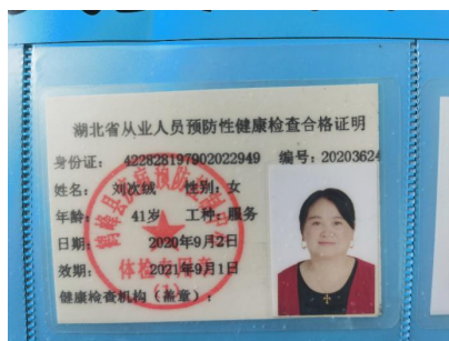
图 I -1 厨师健康证组图