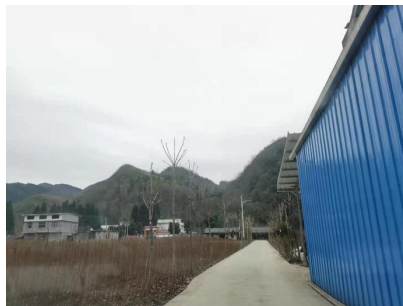
图 1 学校周边街景图

交通说明：从县城出发需前往益通汽车客运站对面的面包车停靠站乘坐前往走马或者五里的客运班车，到达五里乡后转乘五里-下洞的客运班车，在六峰下车。县城-走马线路客运班车首班发车时间为7:30，约1小时一班，车费单程25元一人，车程约100-120分钟；五里-下洞线路客运班车发车时间为10:30，车程约60分钟。下车后步行至该校。