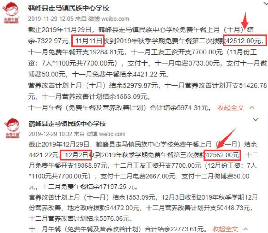
图 2 拨款公示截图