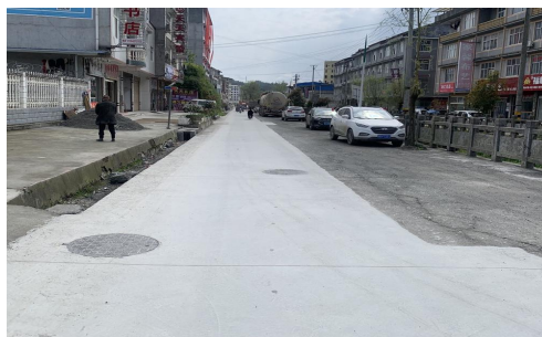
图 1 路况组图

交通说明：从鹤峰县前往走马民族中心学校，可在鹤峰县益通客运站搭乘走马方向的班车至走马镇客运站（早上7:30发车，大约1小时一班车），再从走马镇客运站步行前往走马民族中心学校。