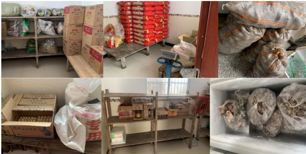
图 I-3 食材储存情况组图