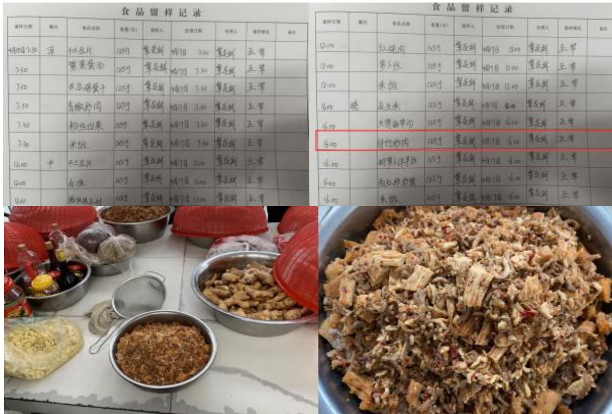
图 4 稽核当日剩余菜品和留样记录组图