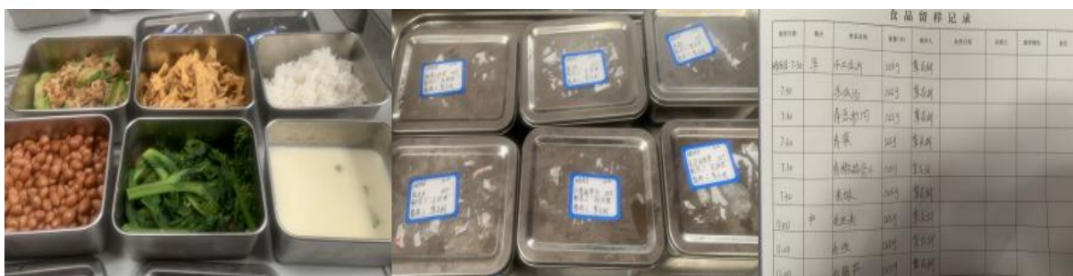
图 I -4 食品留样情况组图