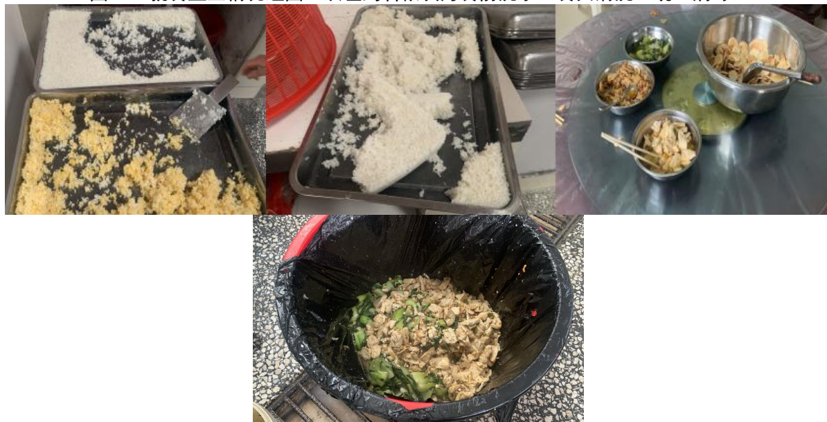
图III-4 从左到右分别为餐后剩余米饭、菜品；餐后泔水桶倾倒