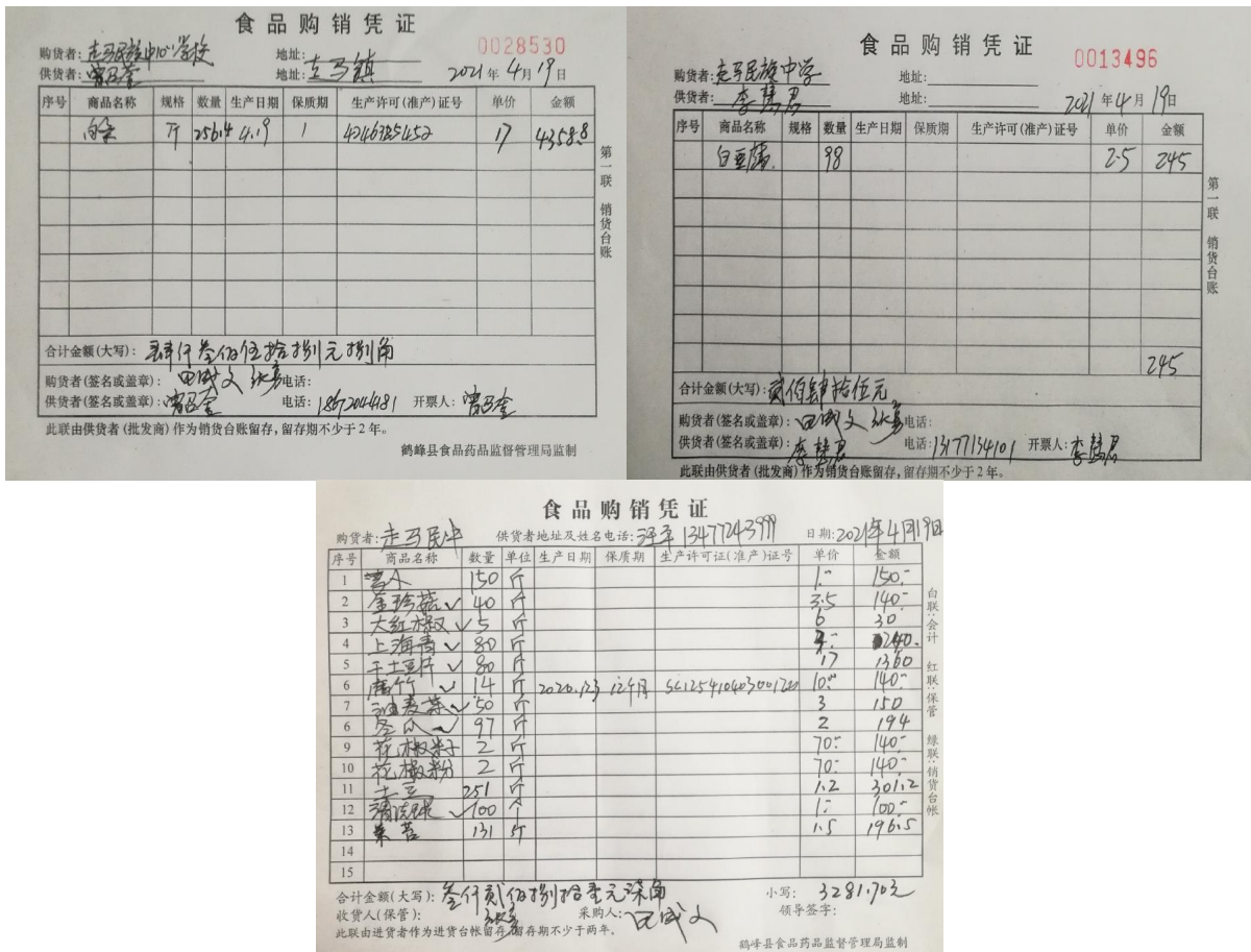
图 II-1 原始凭证组图