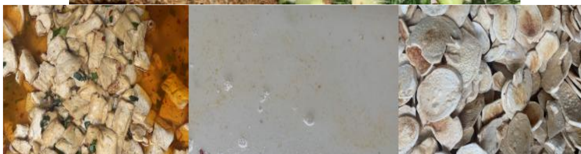
图III-1 开餐当天菜品情况组图