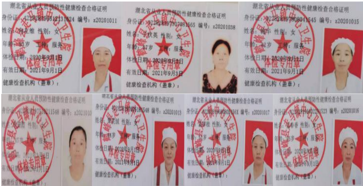
图 I-1 厨师健康证图