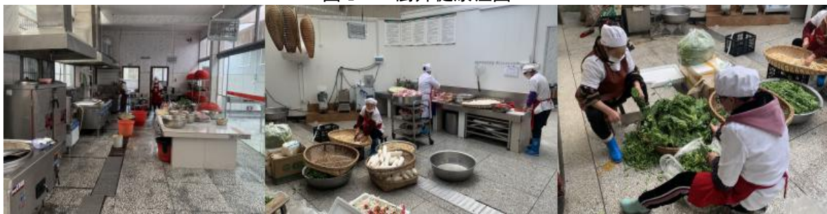
图 I-2 厨师、厨房卫生情况组图