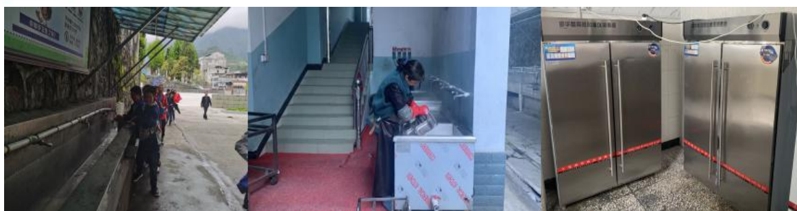
图III-3 就餐卫生情况组图（从左到右依次为餐前洗手、餐具清洗、统一消毒）