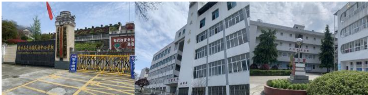
图 3 学校情况组图