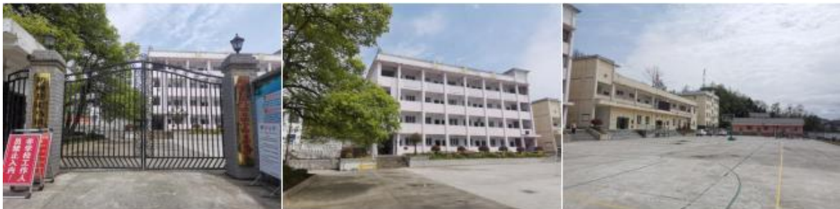
图 3 学校情况组图