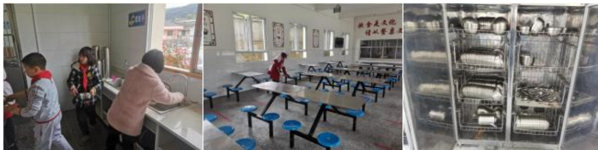
图III-3 就餐卫生情况组图