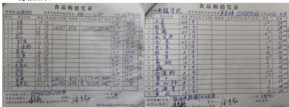
图 II-1 原始凭证情况组图