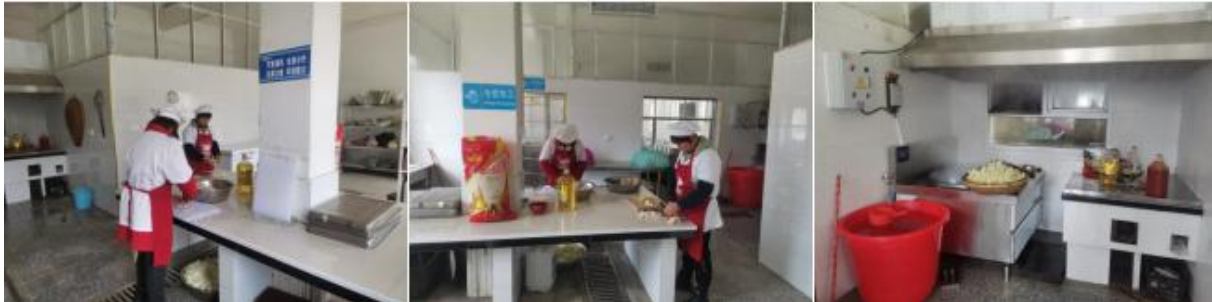
图 I -2 厨师、厨房卫生情况组图