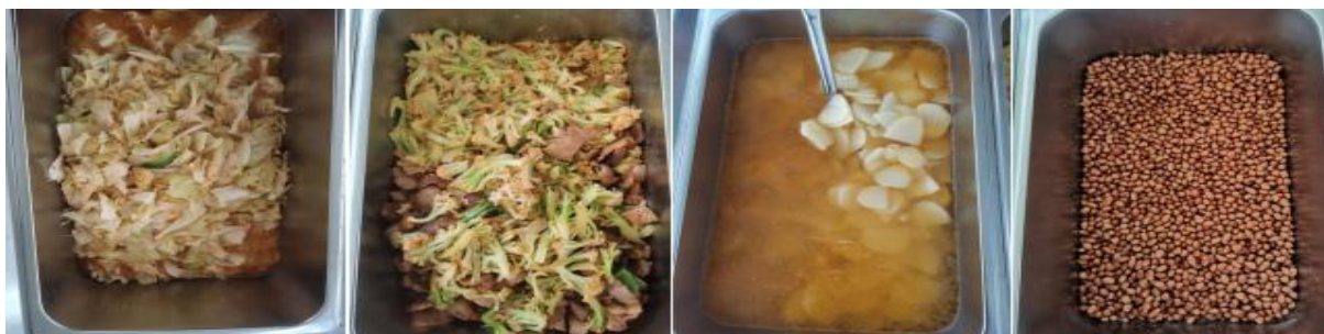
图III-1 开餐当天菜品情况组图