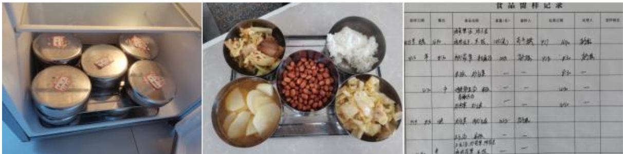
图 I -3 食品留样情况组图