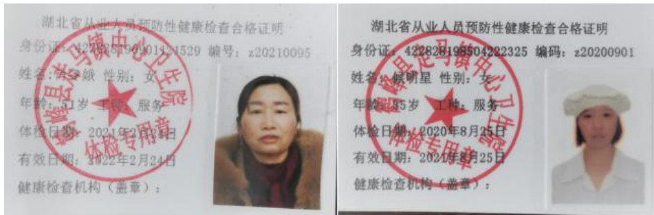
图 I -1 厨师健康证组图