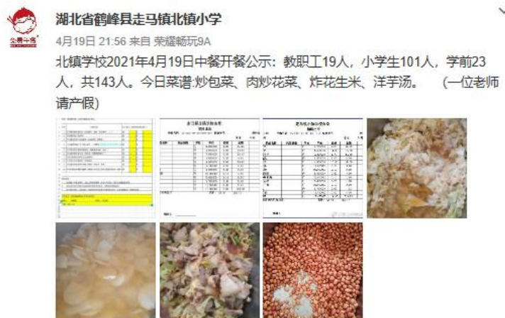
图IV-1 开餐当日微博截图