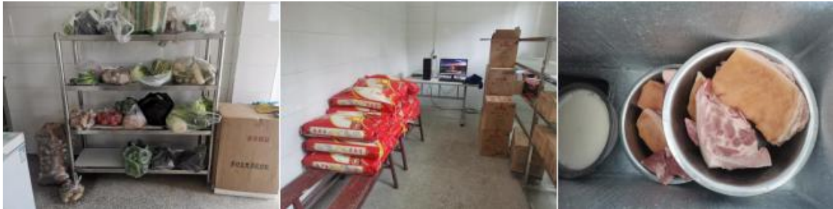
图 I -2 食材储存情况组图