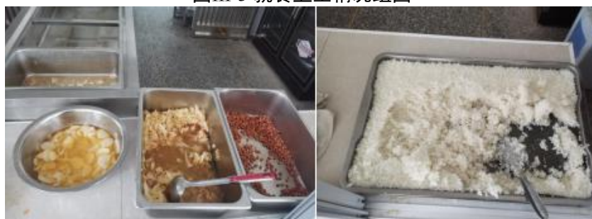
图III-4 餐后剩余情况组图