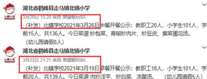
图IV-2 微博扣分说明截图